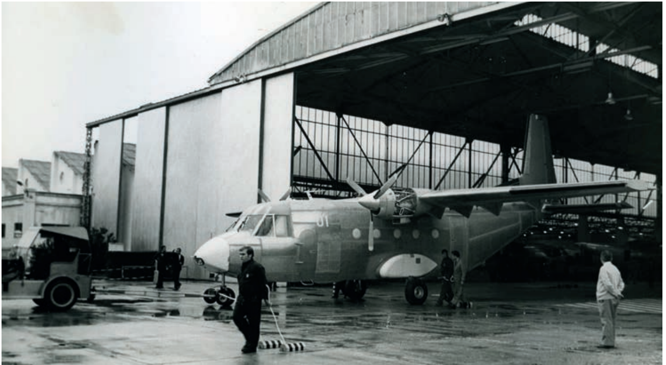
Saliendo de la línea de montaje

siendo los más importantes el Arava y el Skyvan. Pero entonces CASA solo tenía como cliente de sus proyectos al Ministerio del Aire, al Ejército del Aire, por lo tanto, y la posibilidad de exportar se contemplaba como una utopía.