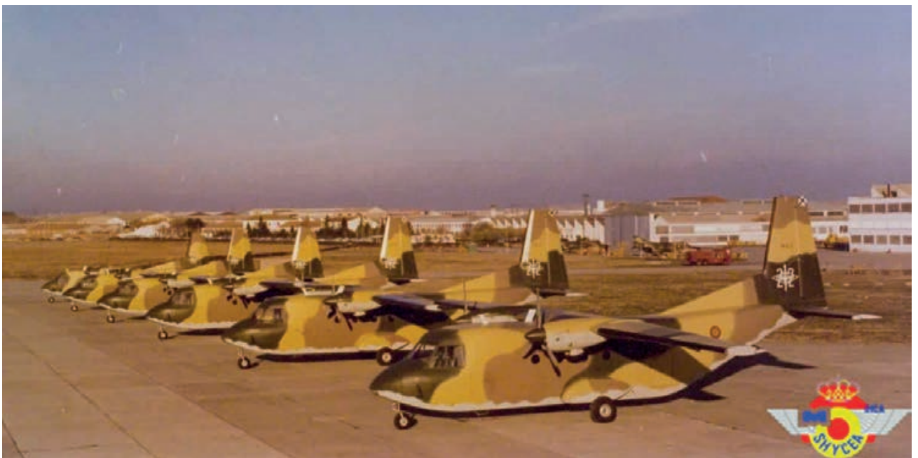
Línea de preserie.

–Menos mal que no lo eráis. ¿Sabes que ese avión ahora mismo está ubicado en la base aérea de Alcantarilla y es el más antiguo de los que tenemos actualmente en vuelo? Es impresionante.