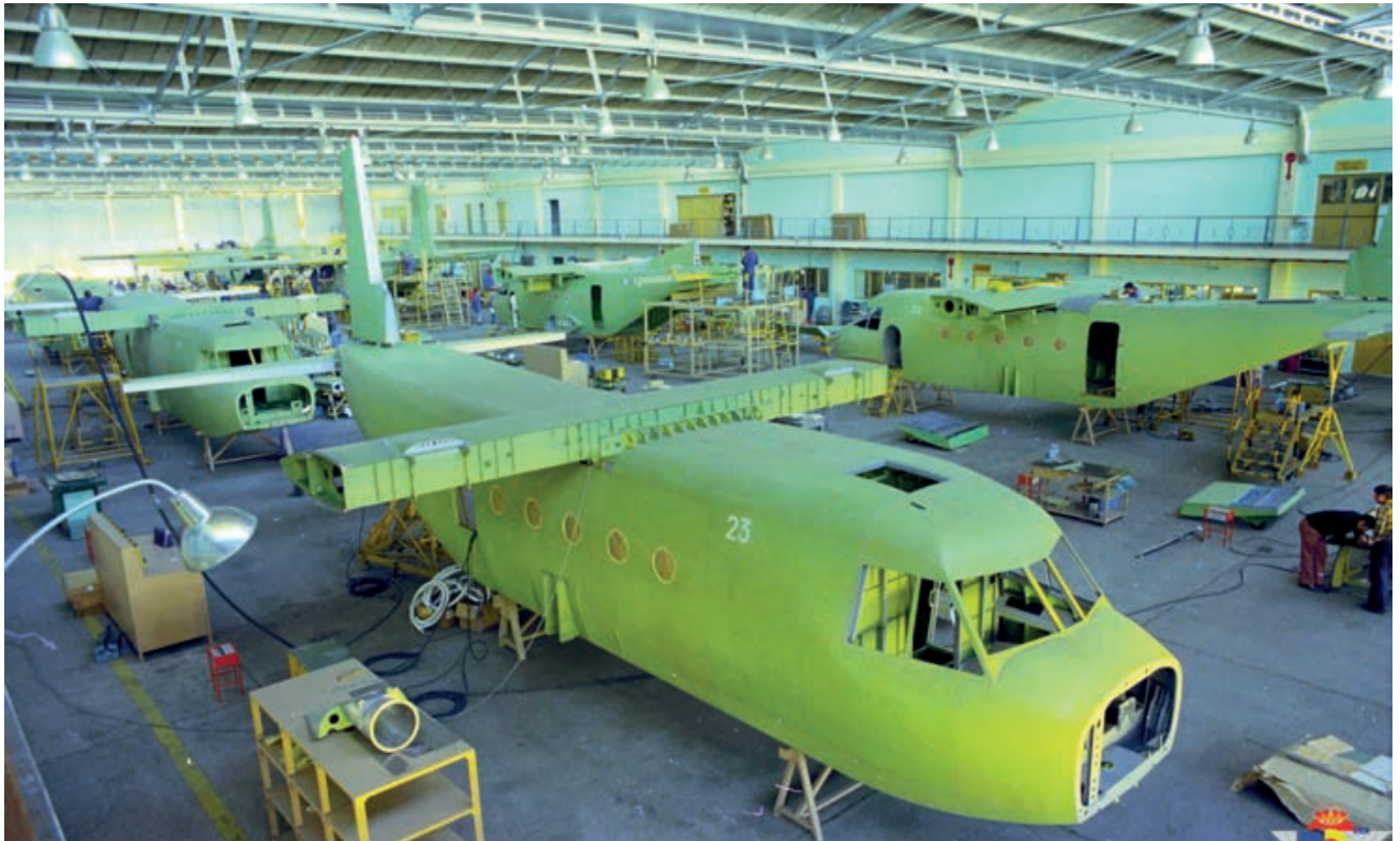
Línea de montaje del C-212

–Yo diría que lo verdaderamente impresionante fue la celeridad y precisión con que se desarrolló el proceso de homologación del sistema, pues solo fueron necesarios once días de octubre de 1976. El lugar fueron las instalaciones del INTA de Torrejón de Ardoz, y la zona de lanzamientos en altitud fue el cercano polígono de Santorcaz. Solo hubo un incidente, más cómico que otra cosa, que se produjo cuando uno de los contenedores lanzado por gravedad fue llevado por un repentino viento racheado hasta el huerto de una finca particular, donde recaló sin más consecuencias que la alarma de los habitantes del lugar. Por supuesto hubo momentos de cierta tensión, siendo el que se llevó la palma el último lanzamiento del programa, el más crítico y decisivo, pues era el LAPES de una plataforma cargada con un peso de 3400 libras. Estaba ya cayendo la tarde y no había excesivo tiempo para segundos intentos. El 461•13 puso en marcha sus motores y cuando enfilaba el camino de la pista se cerró la base ante la anunciada llegada de un Phantom en emergencia. Transcurridos unos minutos de espera que parecieron horas, con los motores en marcha y los nervios de todos a flor de piel, este aterrizó sin novedad y se le autorizó a entrar en pista y despegar. Minutos después se realizó el lanzamiento sin novedad delante de la torre del INTA para alivio y alegría de todos los presentes: la homologación había concluido con pleno éxito.