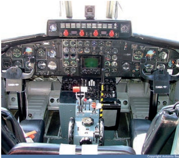
Cabina del C-212

como muestra dos historias interesantes, el sistema de transporte y lanzamiento de cargas y la certificación estadounidense FAR 25 de la versión civil.