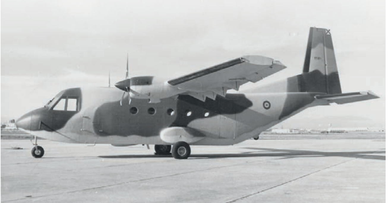
El primer prototipo C-212, con matrícula militar XT.12-1

–Desde luego era inevitable que nos viéramos obligados a atender peticiones y sugerencias tendentes tanto a corregir deficiencias como a mejorar e incrementar la operatividad del C-212. Tuvimos que adentrarnos en terrenos inéditos hasta entonces para CASA. Os contaré