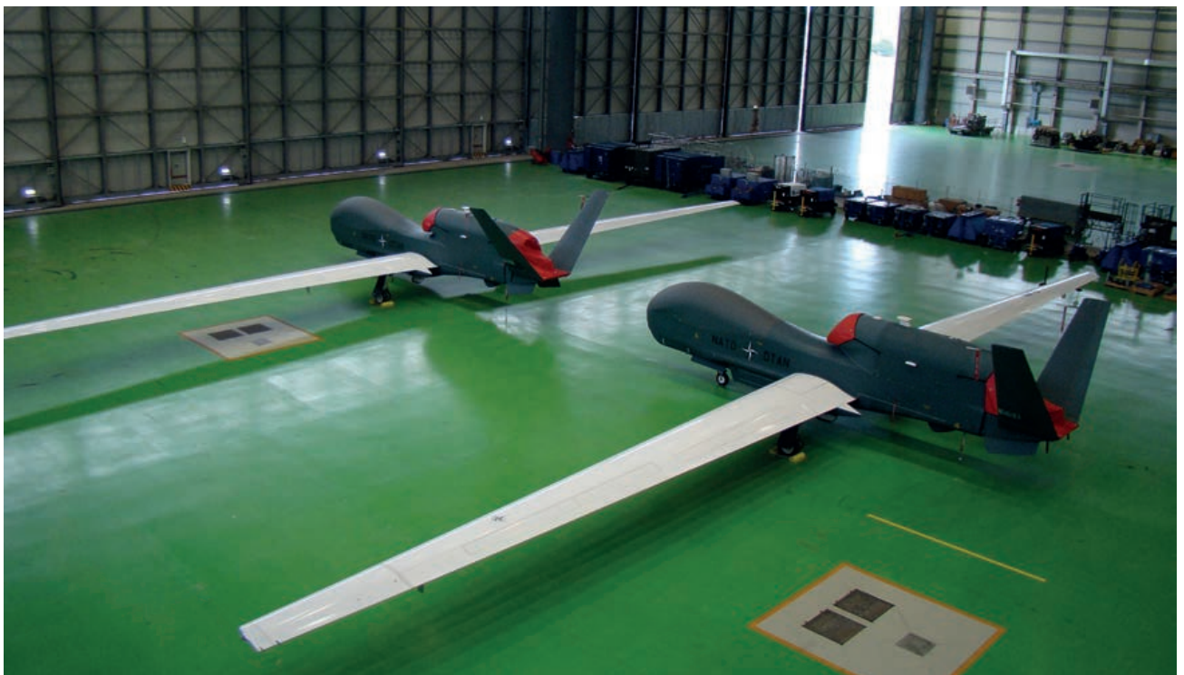
Los dos primeros aviones en el hangar provisional de la NAGSF

Este dossier aborda los aspectos o capacidades más relevantes del sistema AGS, tales como la plataforma y su sensor, la capacidad ISR, las estaciones desplegables, su dependencia de unas robustas comunicaciones y su sostenimiento. Esperamos que el dossier en su conjunto ayude a conocer y comprender mejor el sistema y a entender por qué la Alianza ha puesto tantas esperanzas en él. Pero, sobre todo, queremos dar a conocer lo que puede obtener España de su participación en el programa, y en particular visibilizar la experiencia que el personal español está adquiriendo en la unidad, que puede llegar a ser infinitamente valiosa en el ámbito puramente nacional. ■