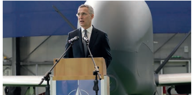
El secretario general de la OTAN, Jens Stoltenberg, en su intervención con motivo de la ceremonia de bienvenida del sistema AGS en Sigonella.

NATO secretary general, Jens Stoltenberg.