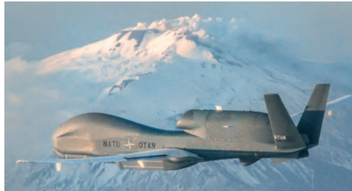
Vuelo de llegada del primer NATO Global Hawk a Sigonella, con el volcán ETNA en el fondo.

Para aquellos que no estén familiarizados con el sistema AGS, basta decir que se trata de un sistema aéreo de vigilancia similar, y hasta cierto punto complementario, al bien conocido sistema de alerta temprana AWACS. La misión de este último es la de la vigilancia del espacio aéreo a fin de informar y alertar sobre movimientos de aeronaves, mientras que el AGS se dedica a proveer de vigilancia y reconocimiento del terreno, tomando imágenes y observando el