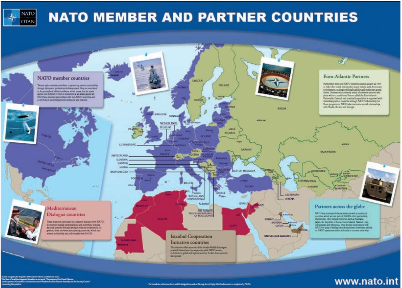
NATO members & partner countries.

flexible adaptado a los intereses de estos y la OTAN, y donde se definen las diferentes áreas de cooperación. Este plan tiene una revisión cada dos años.