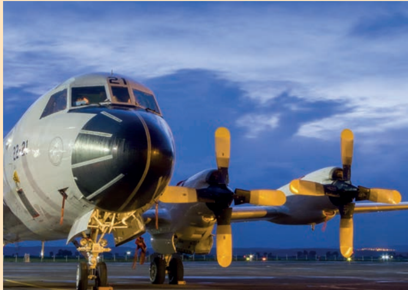
P3 Orion al alba

Durante este periodo, los declarados Programas Principales han continuado evolucionando, pero con retrasos importantes en la incorporación de las capacidades originalmente contratadas, lo que ha obligado a mantener operativas flotas que estaba previsto dar de baja (T.10) o no poder introducir sistemas ya adquiridos en otras (caso del misil Meteor en los C.16).