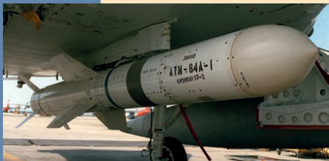
F-18 y misil Harpoon