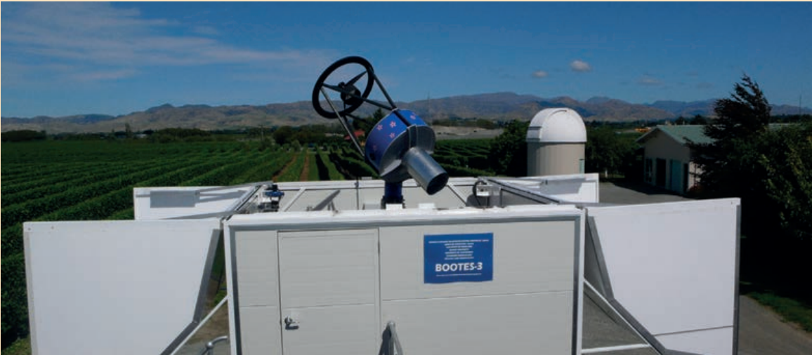
Telescopio de la red Bootes

y dual dentro del proyecto español de Vigilancia y Seguimiento Espacial actualmente compuesto por: