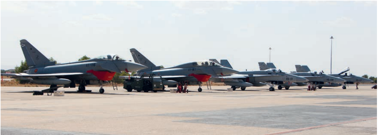
Línea de algunos aviones participantes, en plataforma del Ala 14.

Pero en un Nube Gris no todo es la labor del ESAOGEL, siendo como es uno de los inputs más importantes. Así como en el Mando Aéreo de Combate se coge por un lado al personal que el Mando de Personal educa, entrena y certifica y, por otro, los sistemas de armas que el Mando Logístico recepciona, estudia, mantiene y abastece, para, con esas dos patas, dotar a la Fuerza de un binomio piloto/avión que extraiga