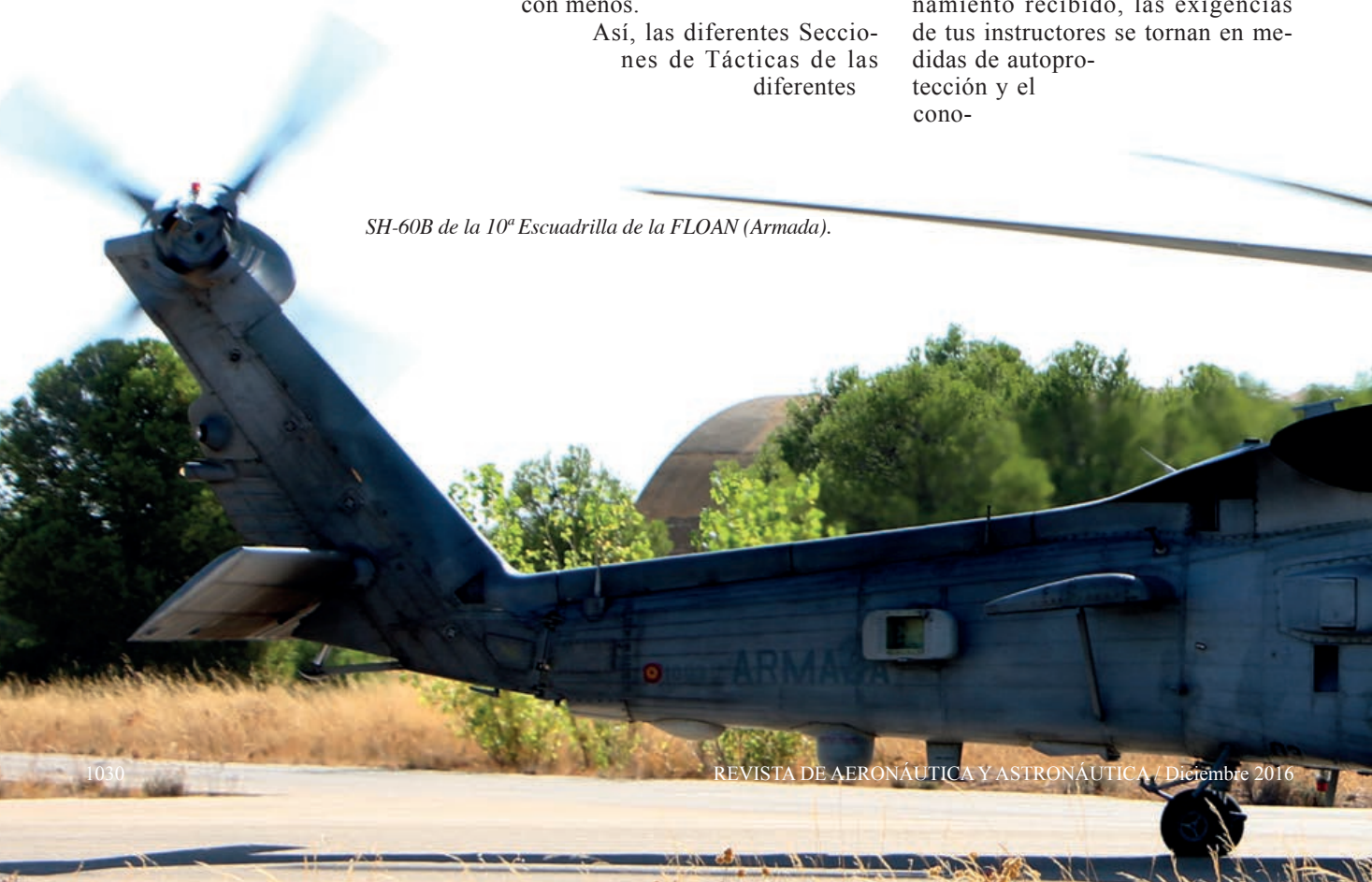
SH-60B de la 10ª Escuadrilla de la FLOAN (Armada).

Alas de Caza tiran de los mejores perfiles para batir cada sistema de armas contemplado, aplicando con el mejor de los criterios las lecciones aprendidas a lo largo de muchos ejercicios de todo tipo, índole y objetivo. Hay veces que pudiera parecer que el entrenamiento se reduce a repetir salidas y volar lo que se te dice, pero cuando resulta necesario dar un paso adelante y afrontar amenazas que pudieran evitar el cumplimiento de la misión, ahí es cuando se nota la calidad del entrenamiento recibido, las exigencias de tus instructores se tornan en medidas de autoprotección y el cono-