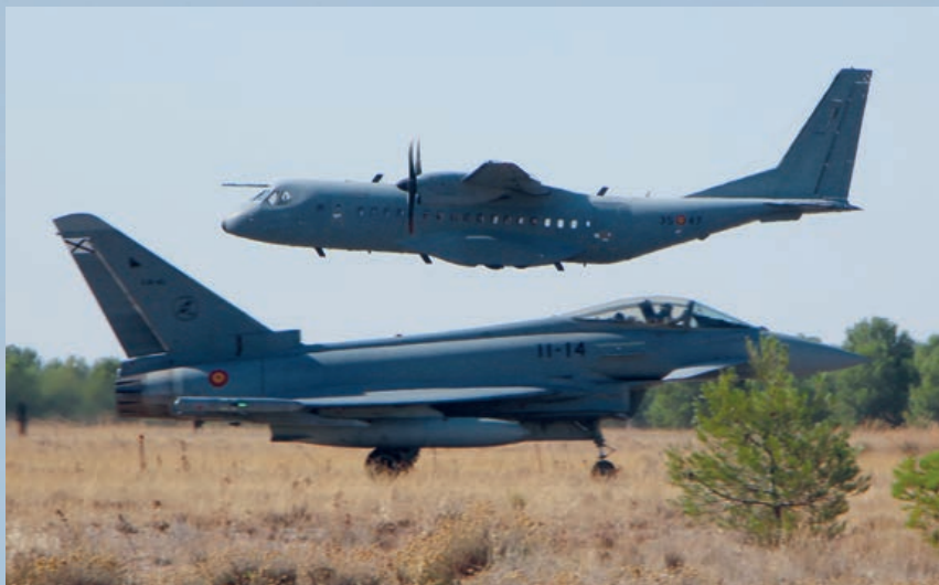
T.21 despegando y C-16 rodando para misión tipo COMAO.

de la conjunción o sinergia de todos ellos. Esto hace que los datos exactos que se presuponen tras las pasadas técnicas no se correspondan punto por punto con lo que se experimenta en la fase táctica.