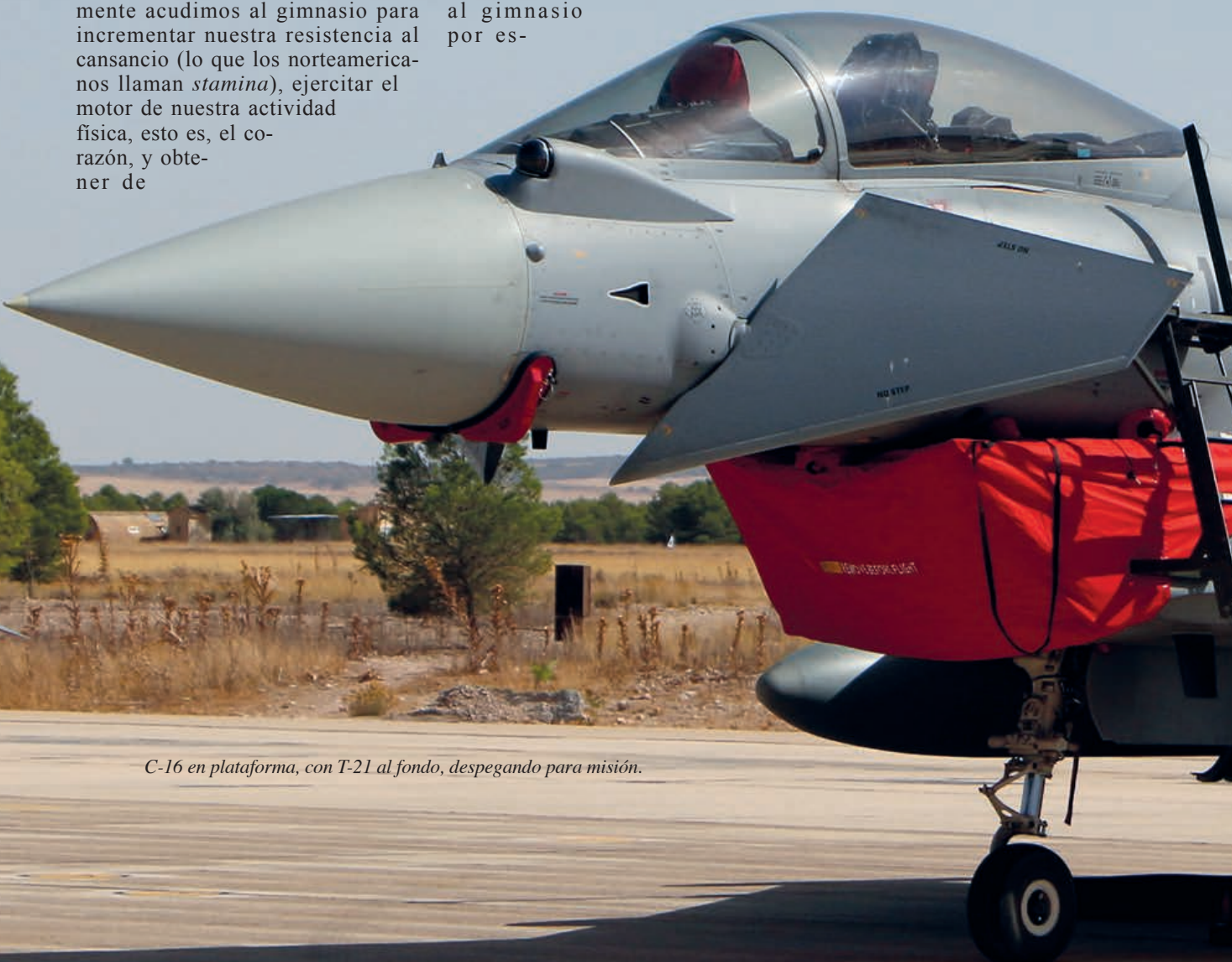
C-16 en plataforma, con T-21 al fondo, despegando para misión.

tas y otras razones, los cazas y sus tripulantes acuden a su gimnasio una vez al año para realizar aquellos ejercicios que les permita entrenarse y estar en forma para cumplir con su misión.