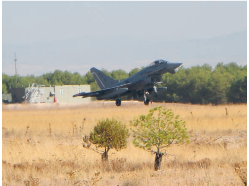
C-16 del Ala 11, despegando para misión A/S.

No se debe obviar la participación, cada día más importante, de aviones de transporte y helicópteros en este tipo de ejercicios. Si bien durante mucho tiempo no se creyó necesario que los aviones politripulados precisaran de protección contra amenazas aire-aire o aire-tierra, lecciones tales como el misil superficie-aire que alcanzó a un avión T.12 del Ala 37 en 1994 mostraron la necesidad de contar con los medios precisos para poder evitar este tipo de ataques. Por otro lado, hoy en día es habitual que nuestros medios de transporte medio y ligero (personificados en los sistemas de armas T.10 y T.21) operen en el teatro africano, ofreciendo apoyo a nuestros aliados franceses en su resuelta lucha contra la intolerancia del Daesh. Siempre he dicho que se requiere una valentía enorme para subirse a un caza que va a tratar de realizar su misión a través de una densa red que es el IADS enemigo; pero no menos valiente es el piloto de transporte que, tras vuelos muy prolongados, de más de diez horas, se dispone a tomar de noche en un campo no preparado, en el que es la primera vez que toma y del que sabe, por informes de Intel, que hay tropas en con-