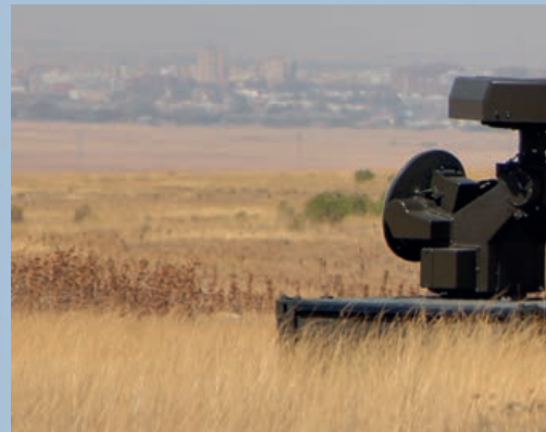
Sistema de defensa antiaérea SKYDOR, del GAAA

Porque no olvidemos que nuestro ejercicio tiene dos variantes, la específica de sistemas, comúnmente denominada Nube Gris Técnico, en la que se trata de acotar cuidadosamente qué pueden y qué no pueden hacer nuestros equipos de Guerra Electrónica (GEL), qué bandas puede escanear y a qué velocidades, cuánto tarda en detectar una emisión LPI (Low Probability of Intercept), etc; y la fase táctica, en la que se conjugan lo aprendido en la fase anterior con el empleo habitual de los aviones en perfiles de ataque. Si bien lo aprendido en la fase técnica puede o no ser re-