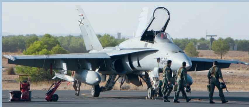
C-15 del Ala 15, preparado para misión ARM.

tador (ALR-400) junto con el perturbador de nueva generación ALQ-500 aseguran la protección del sistema de armas C.15M ante amenazas actuales y las previsibles en un futuro cercano. El DASS, que protege de manera similar al C.16, es el fruto de las mejores industrias tecnológicas de Europa; más en concreto, el DASS ha sido desarrollado por el consorcio EuroDASS, formado por los grupos LEONARDO (italiano, constituido por la unión de SELEX y ELETTRONICA), AIRBUS GROUP (alemán, con sede en ULM) e INDRA de España. Este