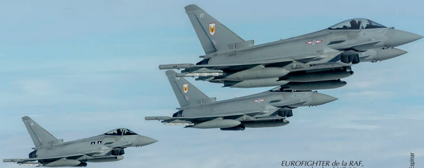
EUROFIGHTER de la RAF, vistos desde el KC-30 desplegado en la BA de Torrejón

El papel del Mando Aéreo de Combate en la gestión de los apoyos de nación anfitriona ( Host Na-