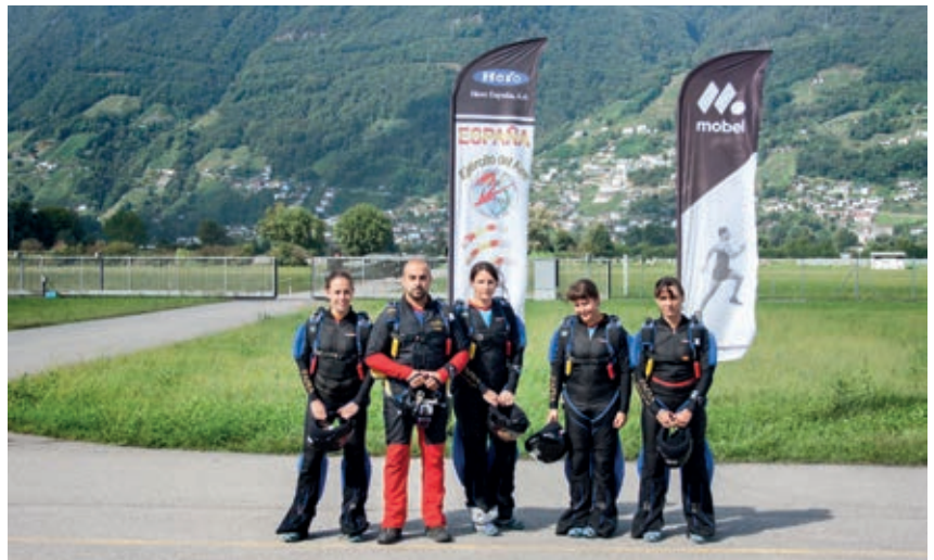
Equipo Femenino de la PAPEA antes de embarcar para un salto de formaciones en Suiza. Año 2015.