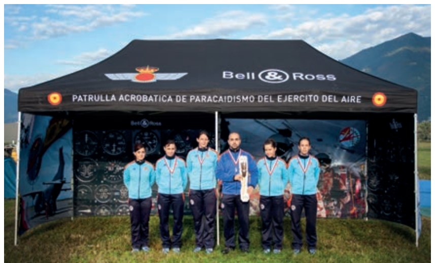
Equipo femenino de la PAPEA y el cámara aire-aire ganadores de la competición de formaciones en caída libre en Suiza. Año 2015.