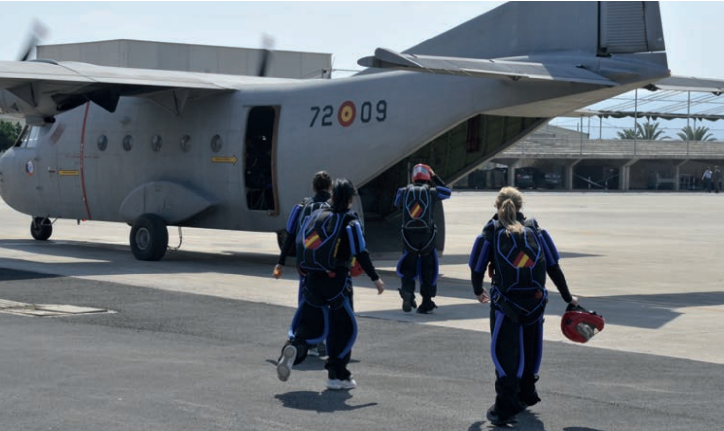
Equipo embarcando.

A partir de mayo de 2015, se retoma el entrenamiento, participando hasta la fecha únicamente en las dos competiciones internacionales reseñadas al comienzo de este artículo.