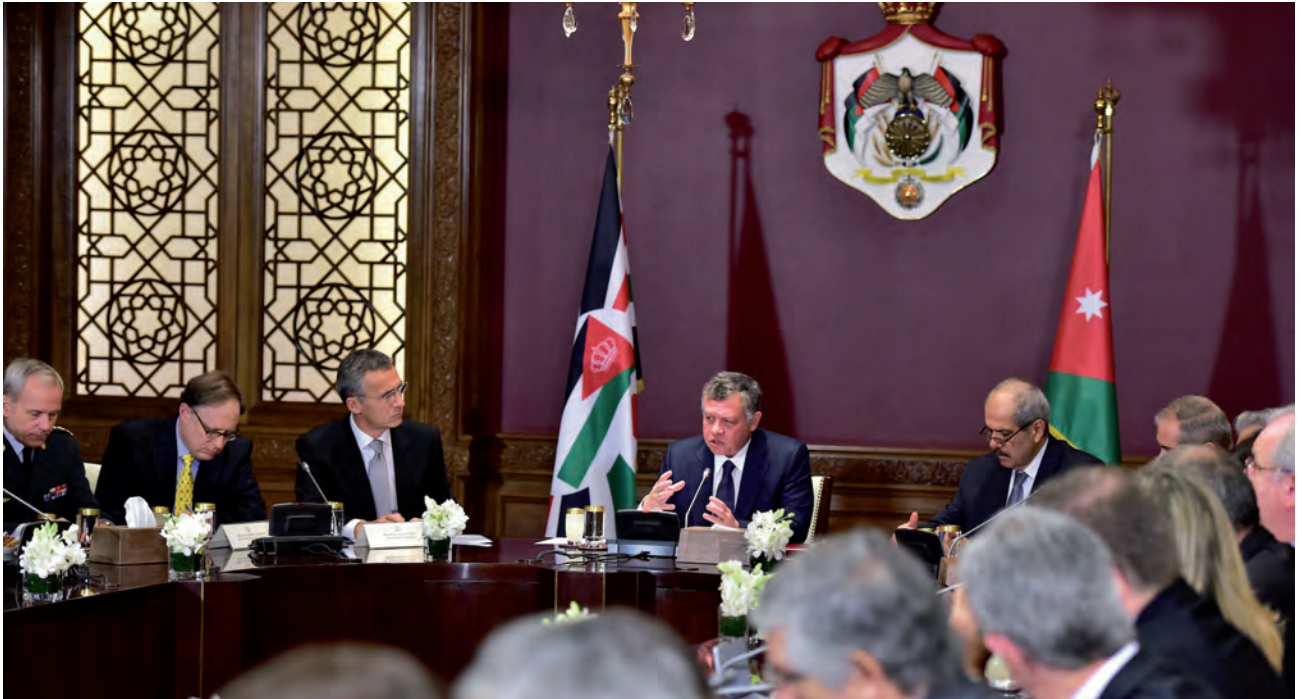
El rey Abdalá II se dirige a los miembros del CAN y representantes de los países del Diálogo Mediterráneo. Amman, Jordania, 10 de diciembre de 2014.

más de la culminación de ISAF y el inicio de la misión Resolute Support , parece oportuno destacar otros dos aniversarios celebrados en año pasado. El Consejo del Atlántico Norte (CAN) visitó Jordania los días 9 y 10 de diciembre de 2014 para celebrar un seminario CAN-Diálogo Mediterráneo (DM) en conmemoración del 20 aniversario del lanzamiento en 1994 del DM. El Secretario General y los 28 representantes permanentes de los países miembros estuvieron acompañados de embajadores de los siete países no aliados que participan en el DM: Argelia, Egipto, Jordania, Israel, Mauritania, Marruecos y Túnez. El Sr. Stoltenberg se dirigió a los reunidos y manifestó: “La seguridad de los países de la OTAN está estrechamente ligada a la seguridad y estabilidad en el Mediterráneo y en el Próximo Oriente”. El SG continuó diciendo: “Eso hace que el DM sea más importante que nunca”. El Secretario General indicó que la OTAN podría ofrecer a los socios más asistencia en los sectores de Defensa y Seguridad, señaló la importancia de que se aumentase la interoperabilidad de las Fuerzas Armadas de los países del DM para operar con las aliadas y pidió que se profundizase en las consultas políticas. El SG mantuvo diver-