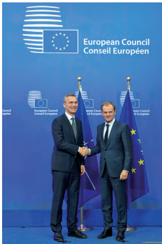
El Sr. Stoltenberg y el Sr. Tusk. Bruselas, 3 de diciembre de 2014.

Para responder a una situación estratégica volátil y para preparar un futuro más estable y seguro, en Gales se tomaron una serie de decisiones cubriendo un amplio espectro de campos.