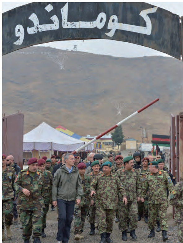
El Sr. Stoltenberg visita en Kabul un campo de las Fuerzas de Seguridad Afganas. Afganistán, Kabul. 6 de noviembre de 2014.

Este año 2015 se celebra el 70 aniversario de la firma en San Francisco el 26 de junio de 1945 de la Carta Fundacional de las Naciones Unidas. La Carta entró en vigor el 24 de octubre del mismo año. El Estatuto de la Corte Internacional de Justicia es parte integrante de dicha Carta. Con la memoria todavía fresca de los estragos producidos por la IIGM, los representantes de 51 países estamparon su firma en el documento que lanzaba al mundo las Naciones Unidas. Los firmantes se comprometieron a mantener la paz y la seguridad internacional, a fomentar entre las naciones relaciones de amistad y a promover el progreso social, la mejora del ni-