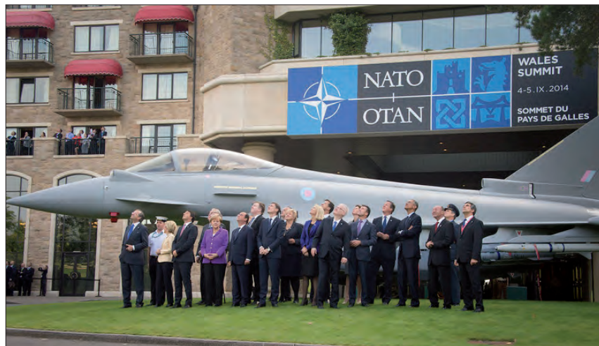
Los líderes de la OTAN observan una exhibición aeronáutica delante de un EF2000 Typhoon. Newport, Gales. 5 de septiembre de 2014.

El año pasado se recordaron los aniversarios (100 y 75) del inicio de dos grandes tragedias para la humanidad. Los que iniciaron la Primera Guerra Mundial (IGM) nunca pudieron imaginar los resultados de aquella sangrienta contienda que causó millones de muertos y cambió profundamente el mapa de Europa pero que no resolvió los problemas subyacentes y alentó en algunos países un peligroso revanchismo. El sentimiento de agravio colectivo de los derrotados y el fracaso de la Sociedad de Naciones i contribuyeron a crear el ambiente que hizo posible la Segunda Guerra Mundial (IIGM) de cuyo inicio se cumplió el setenta y cinco aniversario en el mes de octubre del año 2014. Sin olvidar los aniversarios del año pasado, parece oportuno considerar también la necesaria transformación de tres organizaciones de gran relevancia en el panorama internacional. Esas tres organizaciones fundamenta-