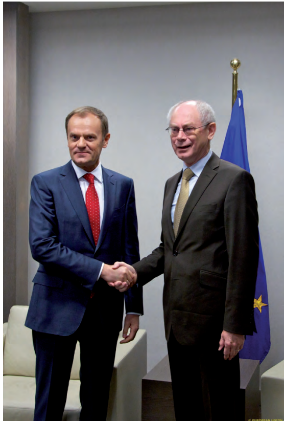
Los presidentes entrante y saliente del Consejo Europeo: Tusk y Van Rompuy. Bruselas, 1 de diciembre de 2014.

La Organización del Tratado del Atlántico Norte es la alianza defensiva más exitosa de la historia y también una de las más duraderas con 68 años de actividad continua. La OTAN ha sabido adaptarse a los cambios de la situación estratégica y ha hecho de la transformación una preocupación prio-