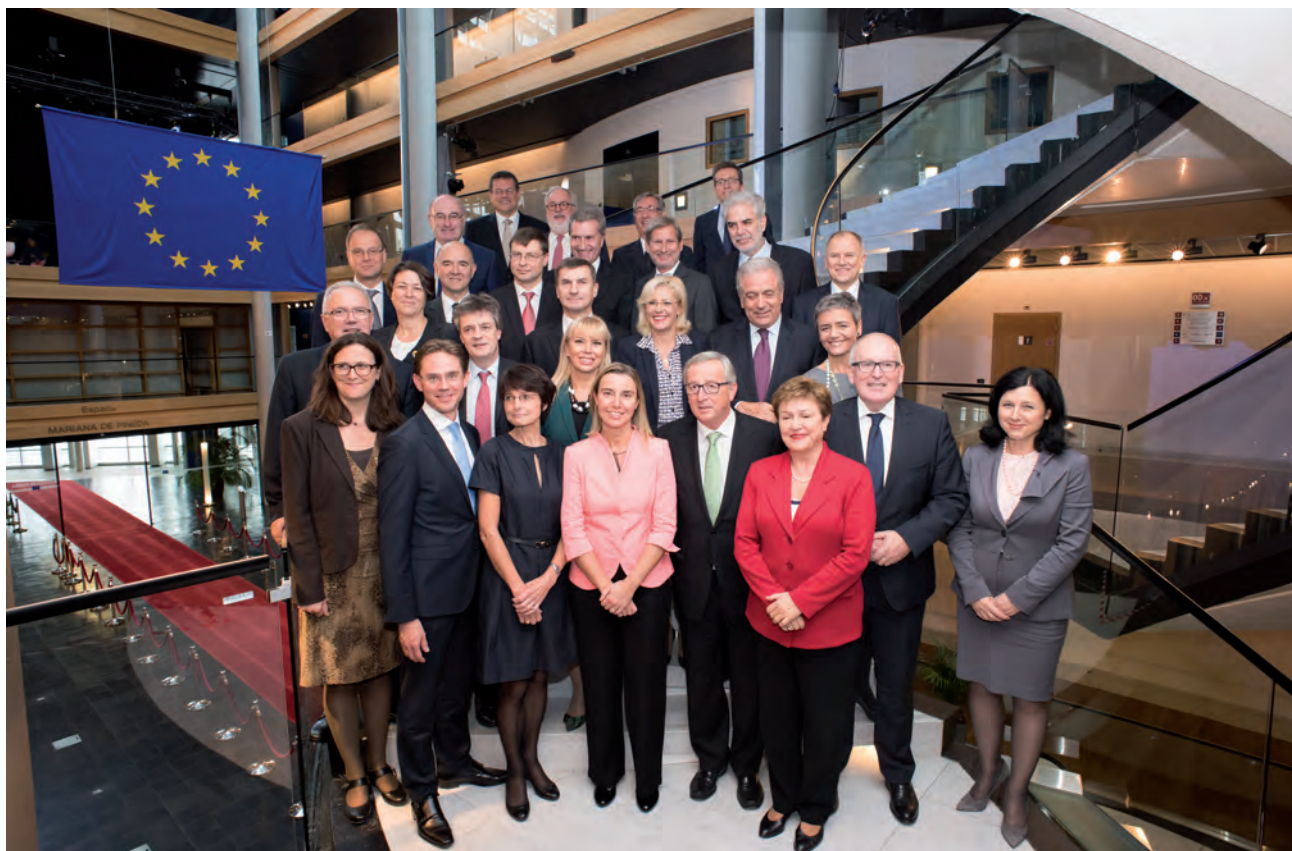
Los comisarios y el presidente de la Comisión Europea Sr. Juncker el primer día de trabajo. Bruselas, 1 de noviembre de 2014.

de Naciones consiguió algunos éxitos en su labor ayudando a resolver varios conflictos en el inicio de la posguerra. La firma de los Tratados de Locarno en 1925 y la posterior del Pacto Briand-Kellogg en 1928 coincidieron con la etapa de mayor prestigio de la SDN. En efecto, durante el periodo 1924-1929 la SDN contribuyó al éxito de la Conferencia de Locarno vi y a la preparación del Pacto Briand-Kellogg. Los Tratados de Locarno fueron un conjunto de acuerdos cuyo principal logro fue que Alemania, Francia, Bélgica, Gran Bretaña e Italia se comprometieran a garantizar el mantenimiento de la paz en Europa Occidental. Los acuerdos firmados en Londres el 1 de diciembre de 1925 fueron los siguientes: