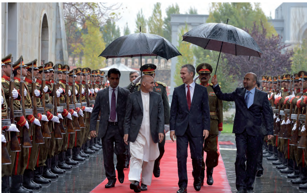
El SG de la OTAN y el presidente afgano Ashraf Ghani. Kabul, Afganistán. 6 de noviembre de 2014.

3. Si no se hubiere celebrado tal Conferencia antes de la décima reunión anual de la Asamblea General después de entrar en vigor esta Carta, la proposición de convocar tal Conferencia será puesta en la agenda de dicha reunión de la Asamblea General, y la Conferencia será celebrada si así lo decidieren la mayoría de los miembros de la Asamblea General y siete miembros cualesquiera del Consejo de Seguridad.