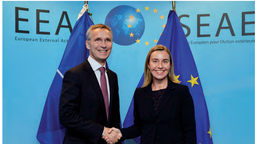
El SG de la OTAN y la Alta Representante de la Unión para Asuntos Exteriores y Política de Seguridad Federica Mogherini. Bruselas, 4 de noviembre de 2014.

Bastan los casos presentados como prueba de la debilidad de la SDN durante toda su an-