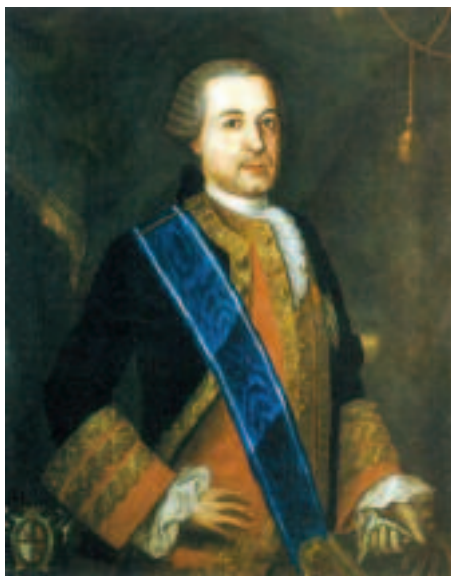
Pedro González de Castejón, marqués de González de Castejón, secretario de Marina, con uniforme de teniente general (Museo Naval de Madrid)

González de Castejón, mantenía una intensa correspondencia con los comandantes de los departamentos marítimos, los capitanes de puerto y los comandantes de las diferentes divisiones y buques. Estos tenían la obligación de volver a puerto cada cierto número de días, para recibir la correspondencia directa de dicho secretario con informaciones de buques enemigos e instrucciones. El hecho de que Castejón fuera marino de guerra facilitaba mucho la interlocución, ya que se hablaba de los vientos, el estado de la mar y los posibles problemas en los buques o la estrategia naval con la naturalidad propia de un marino, algo que también había ocurrido con Julián de Arriaga, su predecesor. Castejón, que había sido el comandante de la fuerza naval en la expedición de Argel, no solo no había salido mal parado del desastre militar, sino que fue designado inicialmente inspector general de la Armada, para posteriormente, a la muerte de Arriaga, ser nombrado secretario de Marina el 31 de enero de 1776. Además, Carlos III le hizo marqués de González de Castejón. Castejón, entonces, se empleó a fondo en la defensa de las costas españolas contra los piratas berberiscos.