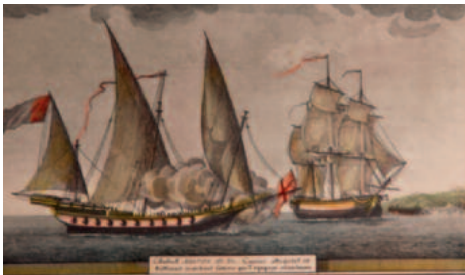
Grabado francés representando a un jabeque argelino

Los jabeques argelinos también habían ido ganando en tamaño y potencia de fuego. Sin embargo, a diferencia de la mayor parte de los jabeques grandes españoles (también de los franceses y de otras naciones) que habían cambiado su aparejo, los jabeques argelinos, independientemente de su desplazamiento, seguían manteniendo el aparejo latino. Tenían bauprés, trinquete, mayor y mesana, como los españoles, pero eran más cortos y de una sola pieza. El trinquete se inclinaba a proa, el palo mayor era vertical y el mesana estaba ligeramente inclinado hacia popa.