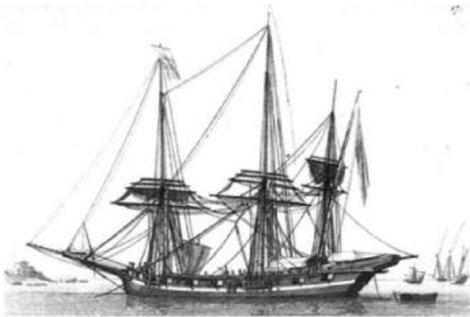
Grabado francés de un jabeque genovés apolacrado

latina. El bauprés formaba con la horizontal un ángulo de 30° (bastante menor que en el caso de navíos y fragatas).