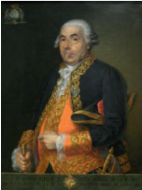
Antonio Barceló siendo teniente general de la Armada (Museo Naval de Madrid)