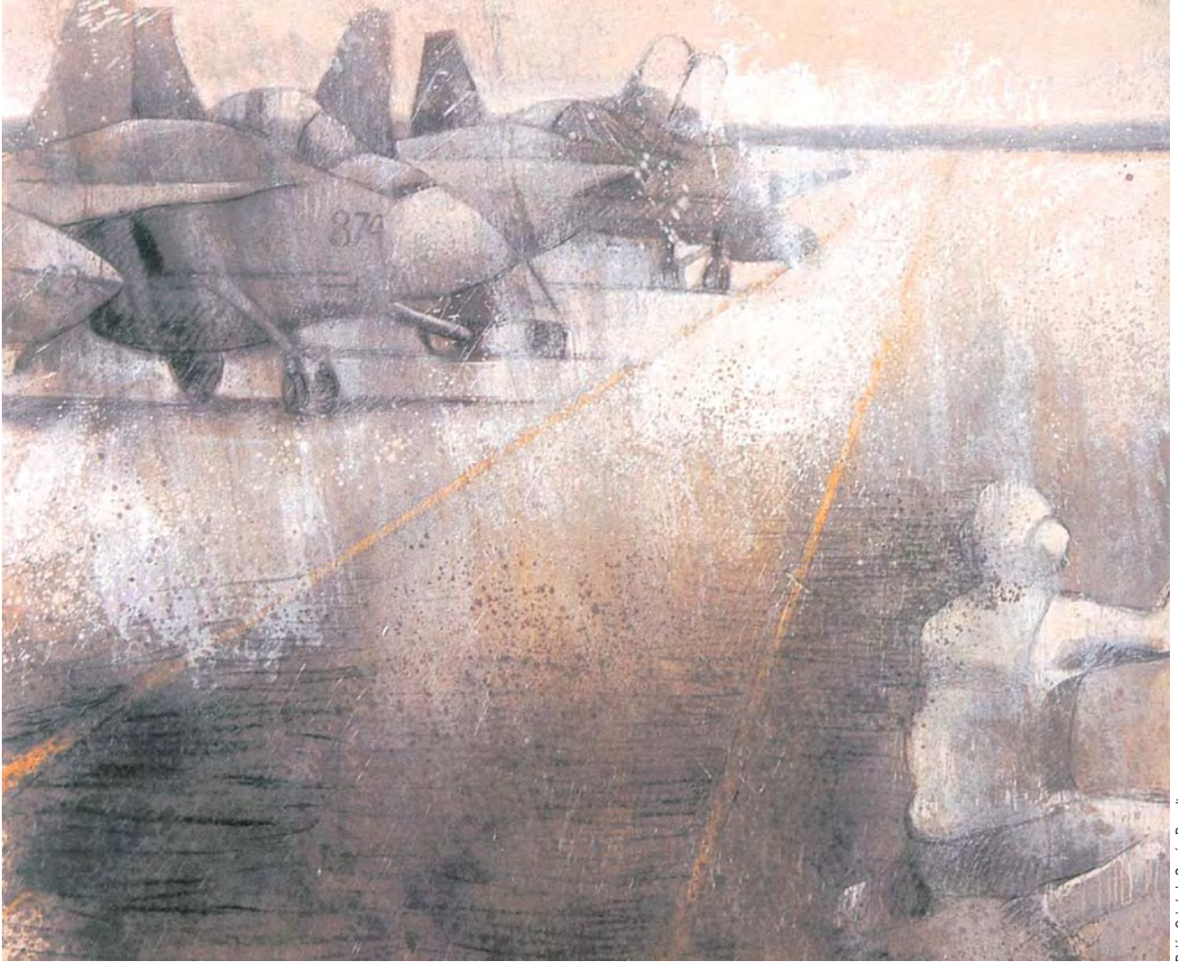
Belén Cobaleda García-Bernalt

En estos asuntos, también los militares tienen que afrontar una auténtica revolución que complica y extiende su formación y educación para poder hacer frente a problemas morales y éticos.