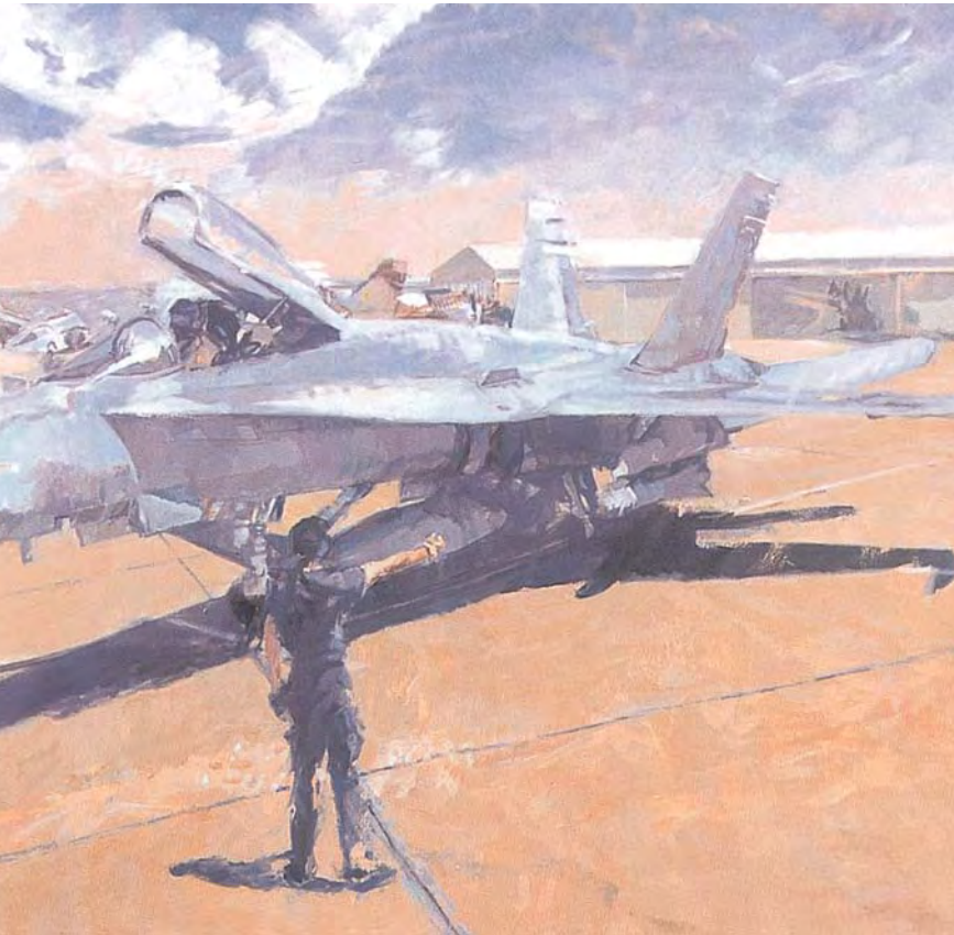
Begoña Sire Moreno

—En el combate son el valor, la abnegación y el espíritu de servicio las virtudes que orientan al militar español, y la dignidad humana y los derechos inviolables de la persona, junto a los principios de proporcionalidad y necesidad los que inspirarán su actuación.