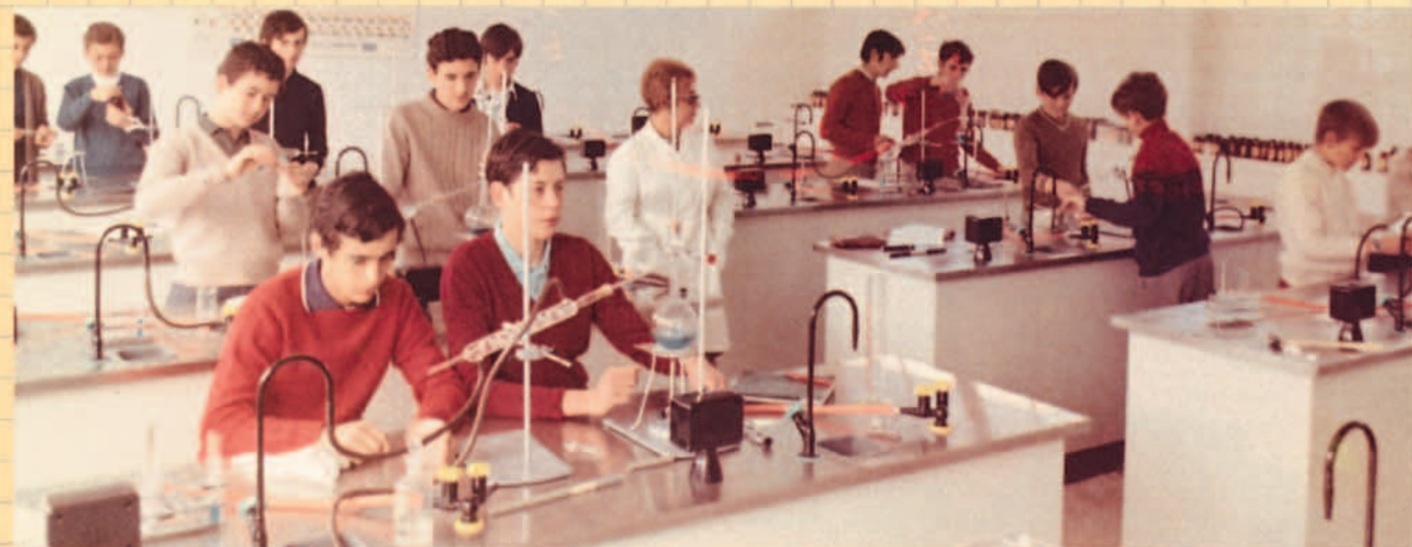
Prácticas en el Laboratorio de Química.