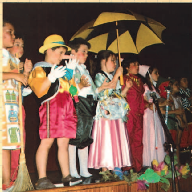
Fiesta de fin de curso en el salón de actos.

plementarias que se desarrollarán durante el curso, propuestas por las tutorías, los Seminarios didácticos o por otras instancias del Colegio, y en consonancia con el Proyecto Educativo de cara a la formación integral de los alumnos. Los seminarios didácticos o departamentos, constituidos por los profesores que desarrollan una misma materia en los distintos cursos y que son imprescindibles para potenciar la investigación didáctica y por ser la plataforma de la formación científica de los alumnos.