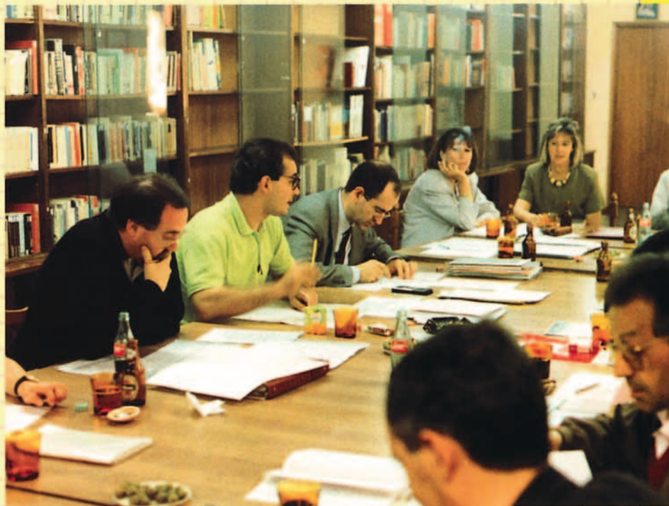
Junta de Evaluación en la biblioteca.

Para el Colegio Ntra. Sra. de Loreto son integrantes de una personalidad completa la dimensión in-