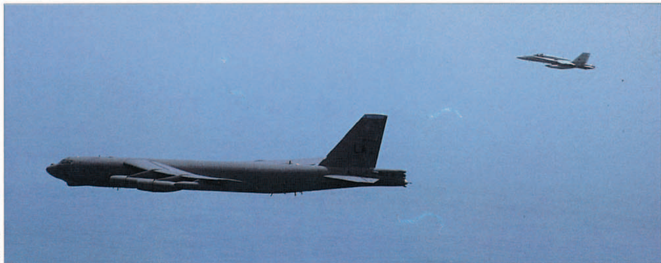
Un B-52 de la USAF es escoltado por un F-18 español pilotado por el teniente Cuenca durante una misión de ataque a muy baja cota a una agrupación naval portuguesa.