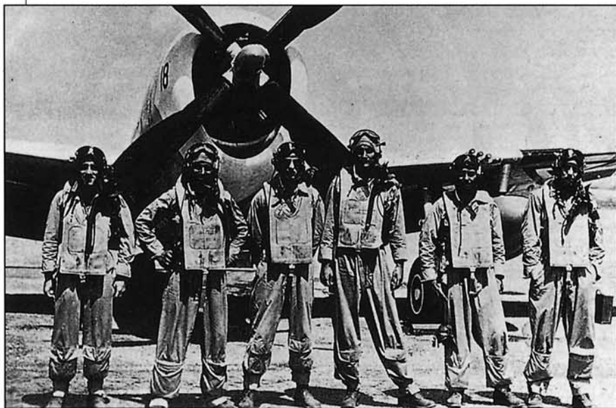
Un grupo de pilotos mejicanos del 201 Escuadrón. Los depósitos lanzables en los puntos del ala son indicativos de la fecha, que podría ser a principios de julio de 1945, cuando la unidad voló en misiones de caza a Formosa

ner la neutralidad, limitando su acción militar en ella a mantenerla vigilada con aviones y buques de superficie.