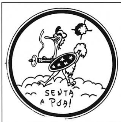
Primer Grupo de Caza brasileño