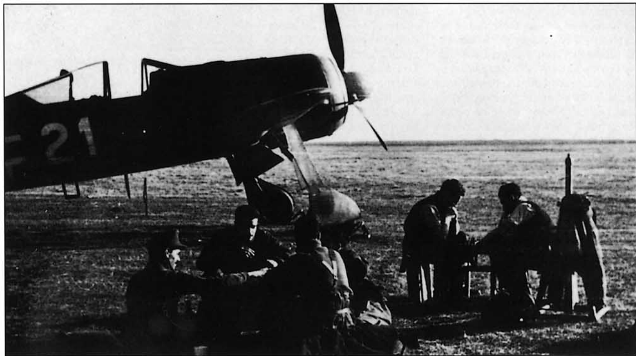
Pilotos españoles de la Cuarta Escuadrilla haciendo tiempo en espera de la orden de despegue