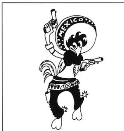
201 Escuadrón de Pelea, mejicano