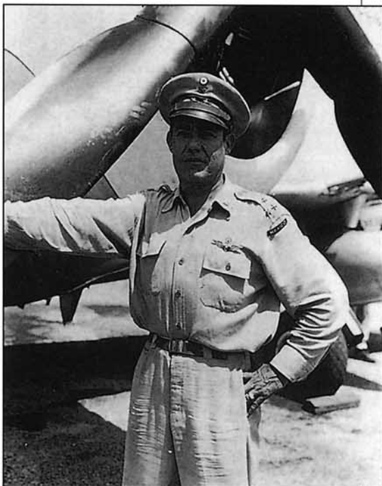
El Coronel Antonio Cárdenas posando junto a un P-47 en el aeródromo de Clark

En cuanto a los resultados positivos, fueron muy altos, ya que fueron derribados en combate por los aviadores españoles, ciento sesenta aviones soviéticos (3), se destruyó un globo de observación, además de cuatro aviones en tierra, y se causaron graves daños a las tropas enemigas en los ataques al suelo.