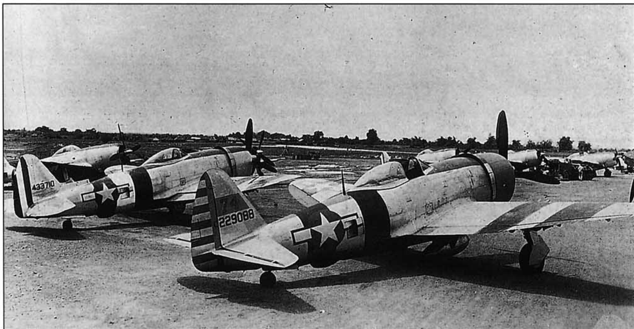
Thunderbolts del 201 Escuadrón, compartiendo la línea de vuelo de Porac con ejemplares del 58 Grupo de Vuelo

201, en la cubierta del acorazado Missouri al ancla en la bahía de Tokio, el 2 de septiembre de 1945, el Escuadrón 201 había realizado 50 misiones de guerra, totalizando 293 salidas en las que había volado 794 horas, arrojando sobre sus objetivos, 293 toneladas de bombas, y disparado 104.000 proyectiles de calibre 50 y 104 cohetes. El resultado de las acciones realizadas por los aviadores mejicanos fue siempre calificado de "bueno" o "excelente", y aunque no tuvieron encuentros con aviones japoneses, hubieron de afrontar fuertes reacciones antiaéreas.