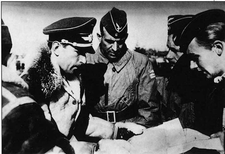
El as de la Luftwaffe, Moelders, cambiando impresiones con el comandante Salas, Jefe de la Primera Escuadrilla española a Rusia

A L amanecer del día 1 de septiembre de 1939, las vanguardias de la Wehrmacht cruzaban la frontera polaca y comenzaban a caer bombas sobre las ciudades de Polonia que se veía abrumada por los demoledores bombardeos de los Stuka, e impotente para frenar los carros de combate alemanes, pese al heroico coraje con que los soldados polacos se enfrentaron a ellos. Aquel viernes dio comienzo lo que la Historia conocería como "Segunda Guerra Mundial", la más grande catástrofe conocida por la Humanidad, que se saldaría con cincuenta y cinco millones de muertos, cambiaría el mapa político del Mundo y, sobre todo, modificaría radicalmente el modo de pensar y de ser del Hombre, dando con ello fin a la Edad Contemporánea-que apenas había durado siglo y medio-, y principio a la Actual.