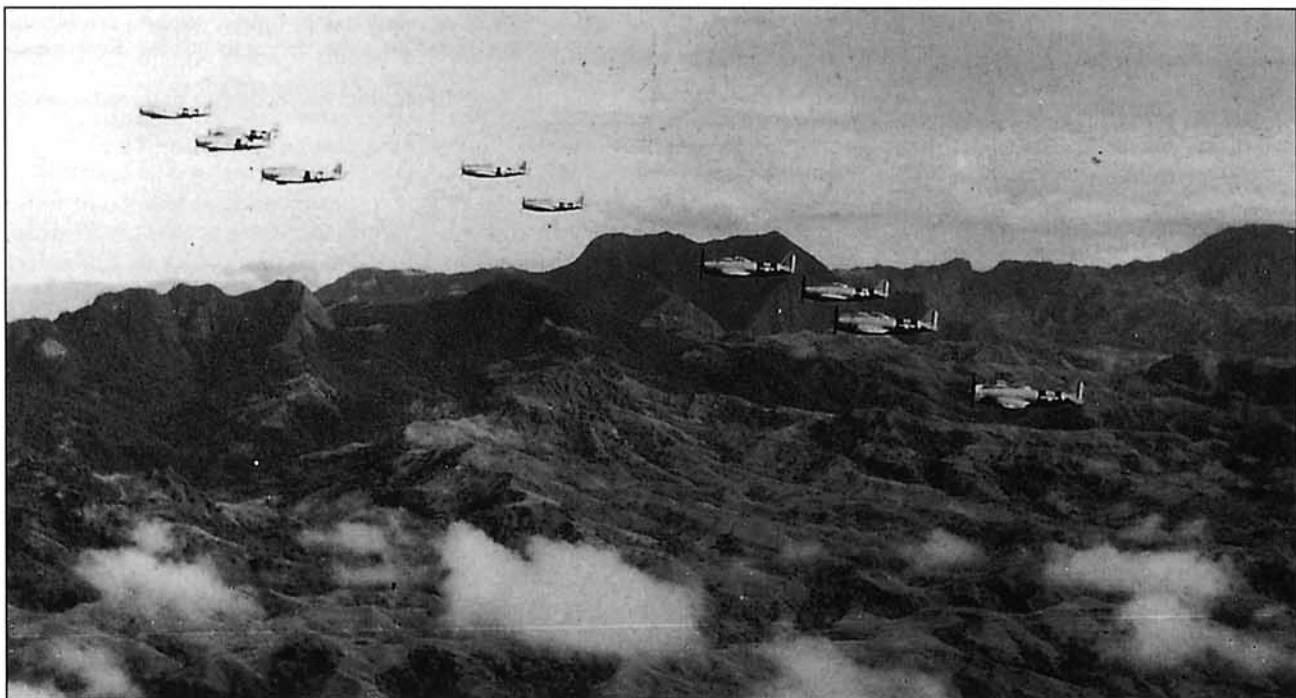
Un vuelo de Thunderbolts sobrevolando las Filipinas, probablemente a finales de julio de 1945. El 201 Escuadrón estaba asignado al Grupo 58, de la 5ª Fuerza Aérea

paró 1.180.200 cartuchos de calibre 50, y 850 cohetes, logrando la destrucción de 1.350 vehículos, 13 locomotoras, 25 vagones de ferrocarril, 8 tanques, 25 puentes, 270 edificios militares, 85 instalaciones artilleras, y centrales eléctricas, fábricas, depósitos, embarcaciones, etc., siendo aún mayor el conjunto de lo dañado.