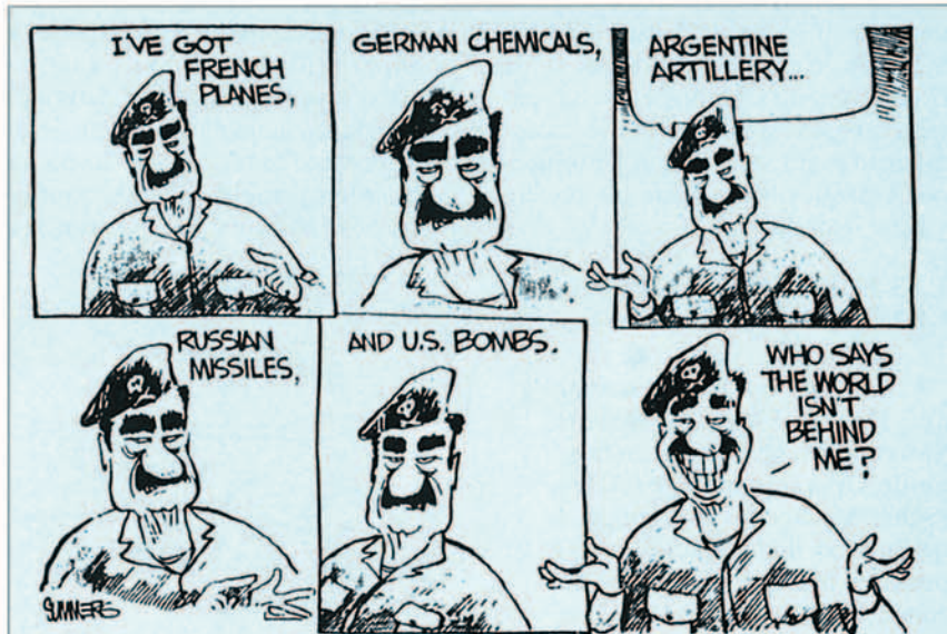
Los dibujos reproducidos en este artículo son algunos de los utilizados por la Coalición en su acción psicológica

Como es lógico, las operaciones de decepción formaban parte de un plan integral de la estrategia de Desert Storm. Su planteamiento comenzó a principios de agosto y permaneció como un elemento esencial durante toda la campaña. El objetivo de estas operaciones era desorientar al enemi-