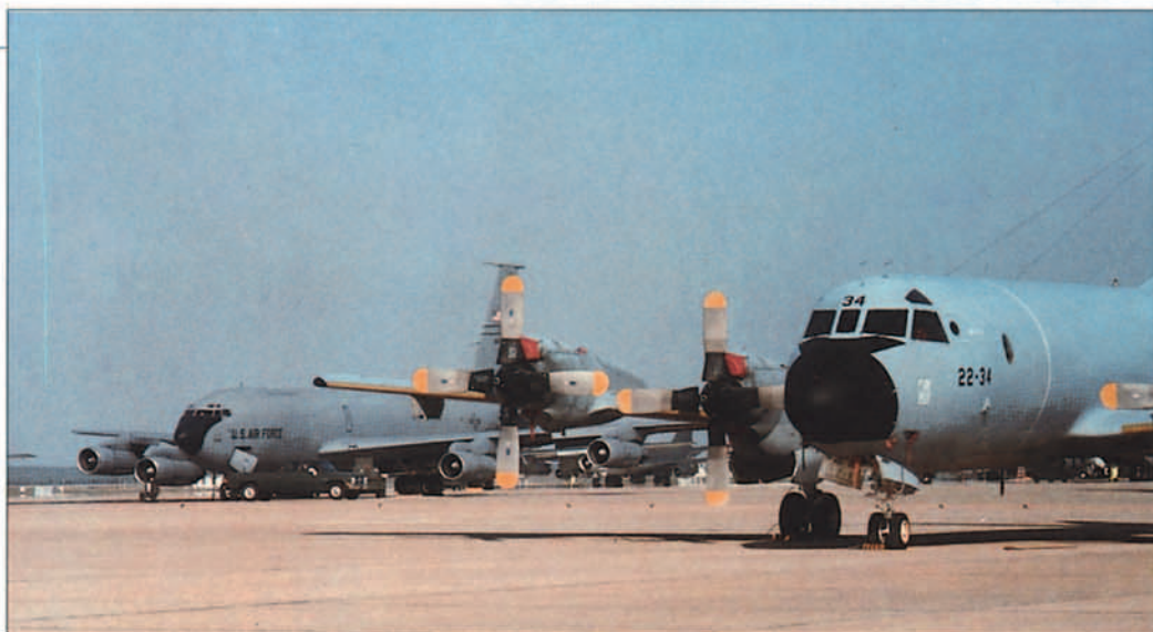
Los KC-135E comparten el aparcamiento de la Base con los P3 del Grupo 22 recién trasladado a Morón desde Jerez.