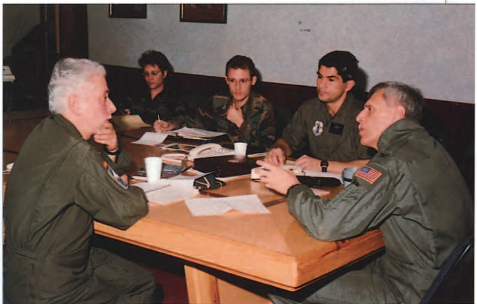
"La acogida española ha sido muy cálida y la colaboración de las autoridades excelente".

El coronel Joseph K. Simeone, comandante del 157 Grupo de reabastecimiento en vuelo de la Air National Guard del estado de New