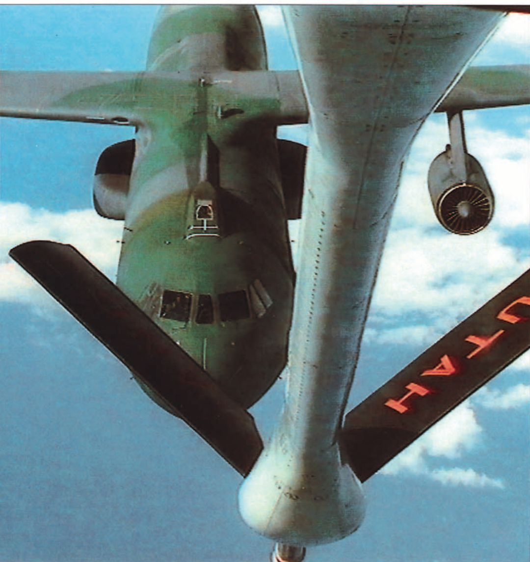
Reabasteciendo al C-141.