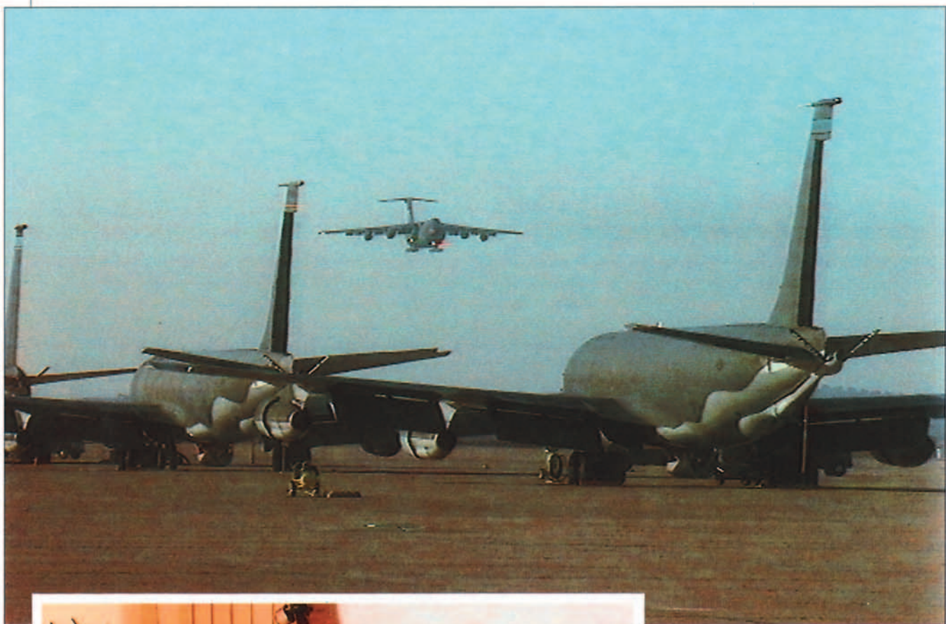
La pista e instalaciones de la base aérea de Morón son idóneas para este tipo de operaciones.