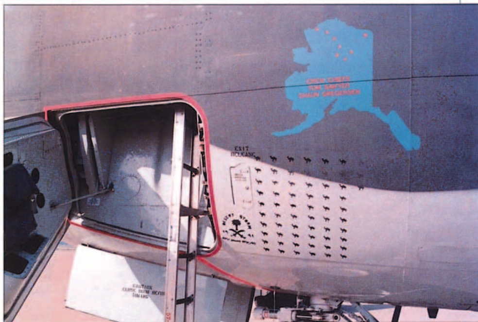
De la operación "Desert Storm" a la operación "Restore Hope".

¿Puede decirnos algo sobre su Unidad de origen y la Guardia Aérea Nacional a la que pertenece?