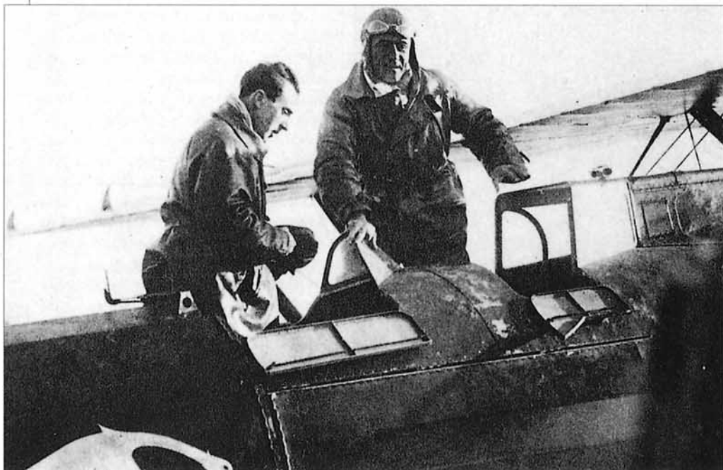
Costes y Bellonte (de derecha a izquierda) al término de su vuelo record de distancia.

El "Point d'Interrogation" se conserva en el Museo del Aire que tiene sus instalaciones en el aeropuerto de Le Bourget, pero en alguna ocasión solemne se le ha podido ver extra-muros. Al menos, durante el mes de junio de 1971 fue exhibido al aire libre del aeródromo en ocasión del XXIX Salon de l'Air et de l'Espace. Al cabo de los años, todavía sonaba bien, francamente bien, su motor Hispano Suiza, podemos dar fe. ■