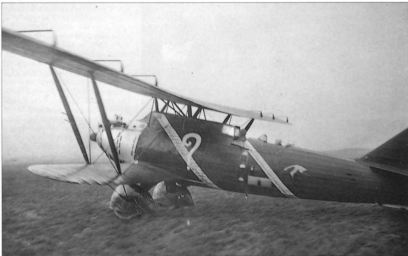
1930. Avión "Point d'Interrogation" de Costes y Bellonte. París-Nueva York sin escalas.