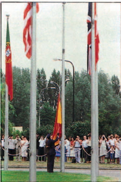
Izado de la bandera española en la sede de la OTAN.

A su vez las dificultades económicas y financieras, junto a la presión demográfica de estos países y al integrismo islámico, son posibles agentes desencadenantes y diferentes crisis, que en el aspecto militar ello pudiera realizarse a través de: