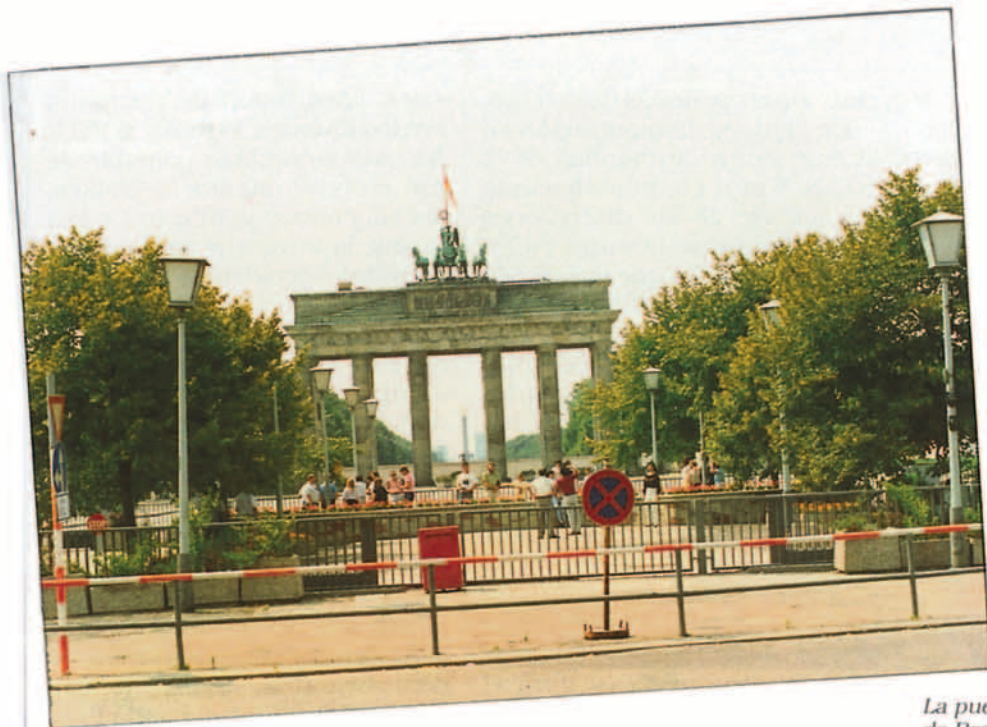
La puerta de Brandenburgo vista desde el lado oriental.