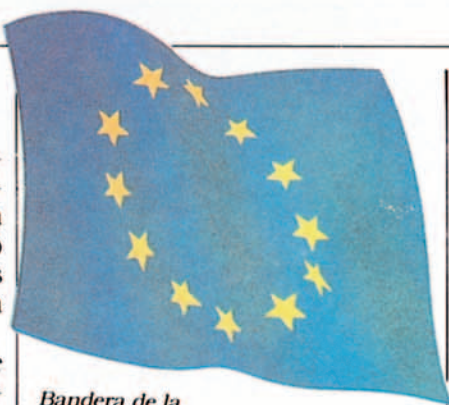
Bandera de la Comunidad Europea.

La Disuasión Nuclear creíble de la OTAN ha funcionado correctamente, pero estaba basada