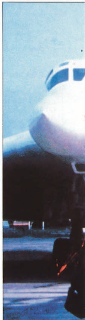
Bombardero soviético Tupolev TU-160 Blackjack.

Por consiguiente, nuestros conceptos estratégicos ante dichos riesgos han de ser complementarios entre sí, e incluso superpuestos, para que el esfuerzo militar a realizar pueda contribuir a la doble finalidad. Así mismo, ambos conceptos estratégicos han de tener un