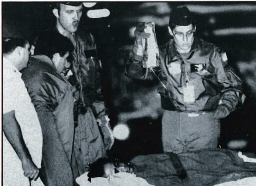
Un pasajero de avión secuestrado es recogido por personal sanitario tras su entrega por los terroristas.