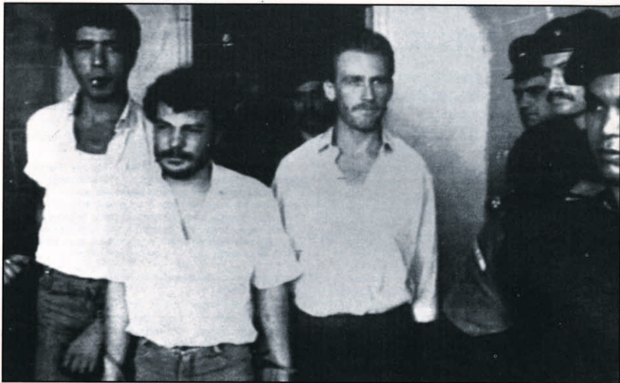
La liberación de prisioneros ha sido uno de los motivos frecuentes en los secuestros producidos por terroristas árabes.

la Seguridad Social americana le debía 47.178 dólares que no se le hicieron efectivos, por lo que decidió secuestrar un avión de la TWA, pidiendo la suma de 100 millones de dólares como rescate.