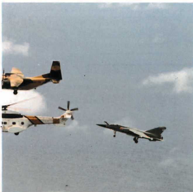
Un Mirage F-1 del 462 Escuadrón vuela en formación con un Tornado del 2 MFG1 Escuadrón de la Base aérea alemana de Schleswig, con motivo de los intercambios que, periódicamente, realiza el 462 Esdrón, con unidades de la OTAN.