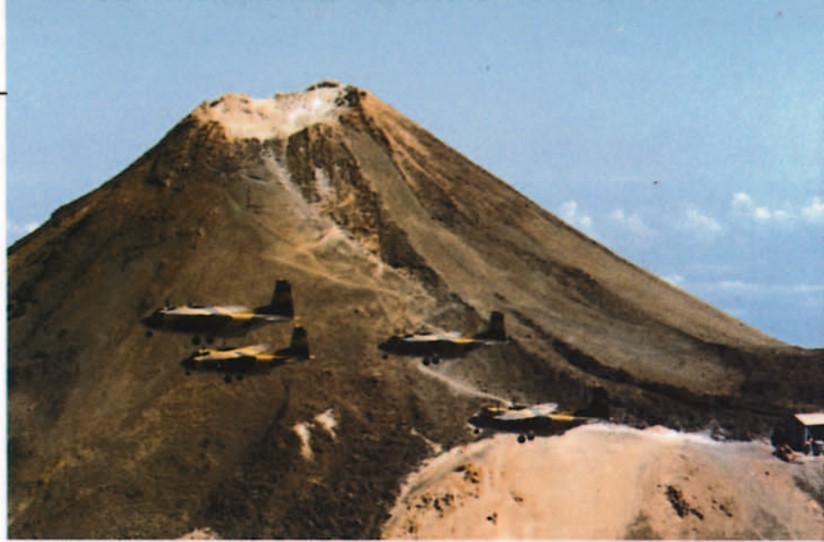
El pico del Teide es frecuente testigo del paso de los aviones del MACAN en sus vuelos de instrucción. En la fotografía una formación de Aviocar.

— Llevar a cabo los transportes aéreos necesarios para el desarrollo de las operaciones.