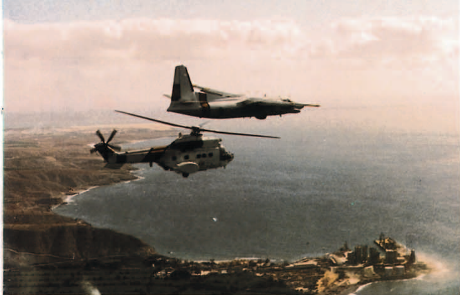
Los aviones Fokker-27 y los helicópteros Superpuma del 802 Escuadrón aparte de sus misiones específicas, prestan frecuentes servicios en evacuación de heridos y enfermos a las poblaciones de las islas.