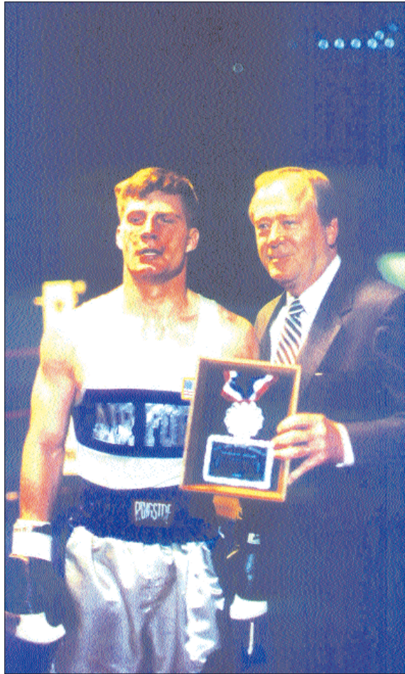
"Wing Open Boxing Championship". Un gran sacrificio por una noble causa.

Para garantizar la imparcialidad, el jurado que se encarga de los casos del Código del Honor está formado por un oficial de la Academia y 6 cadetes de cursos superiores elegidos al azar y sin relación directa con el acusado. Durante mi estancia en la Academia tuve la oportunidad de ser jurado en una ocasión y me impresionó el ritual y la profesionalidad con que se desarrolló el juicio. La verdad es que no es para menos, pues del veredicto final depende la continuidad del acusado en la Academia y no sólo eso, ya que el ser expulsado por una "causa de honor" dificulta la admisión en otra universidad del país. Obviamente, el juicio es el último recurso, pues previamente se efectúa una minuciosa investigación para esclarecer los hechos, y según el grado de la falta, se le ofrece al inculpado la posibilidad de reconocer su autoría renunciando libremente a su estancia en la Academia. Los casos cuyas faltas no sean tan graves se rigen por el régimen disciplinario de la Academia con un sistema de arrestos tramitados a través de la cadena de mando.