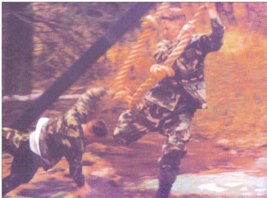
Desde el campamento, los cadetes ponen a prueba su valor y pericia.