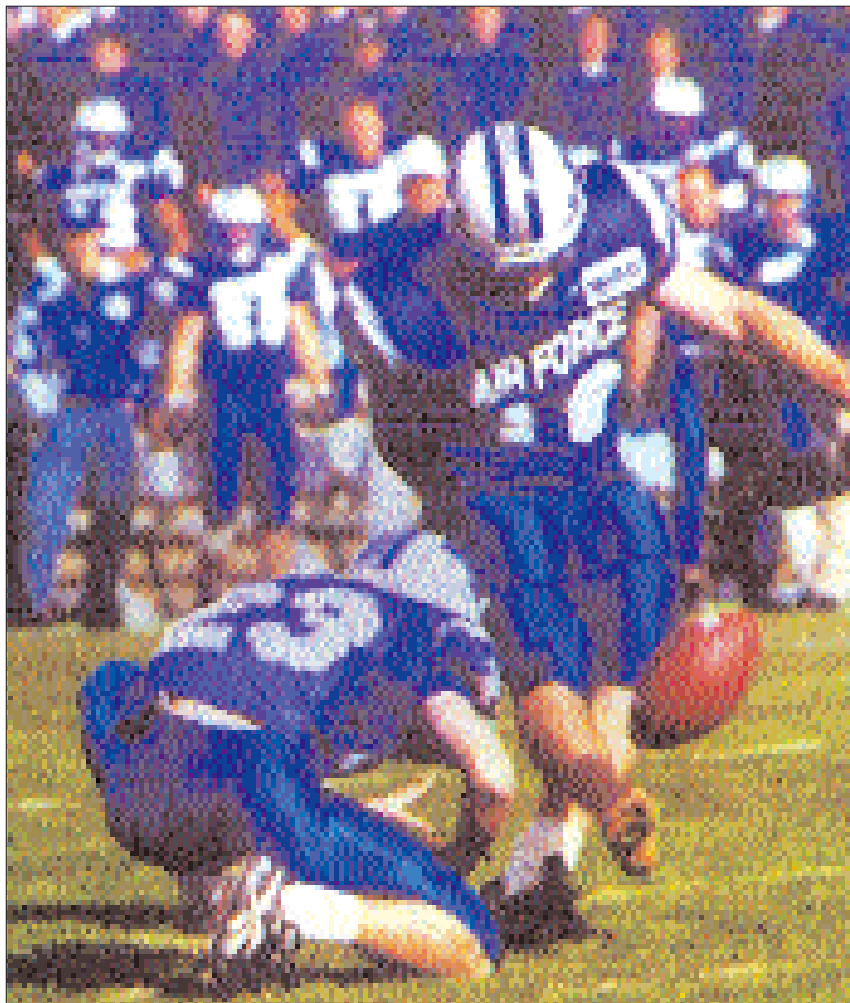
El equipo de fútbol americano de la USAFA consigue reunir a más de 40.000 espectadores en sus eventos deportivos.