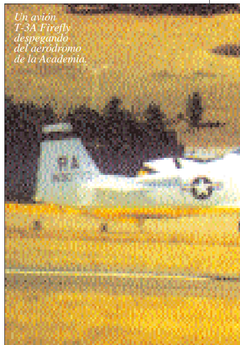
Un avión T-3A Firefly despegando del aeródromo de la Academia.