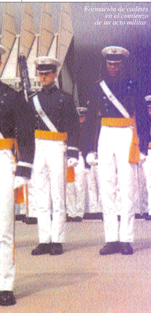
Formación de cadetes en el comienzo de un acto militar.