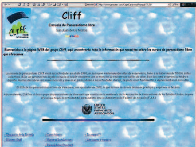
http://www.geocities.com/CapeCanaveral/Hangar/7125/ Grupo De Paracaidismo Cliff

de mi vida, la cual me dejó una gran cantidad de experiencias y amistades”.