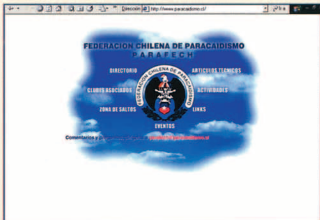
http://www.paracaidismo.cl/ Federacion Chilena de Paracaidismo