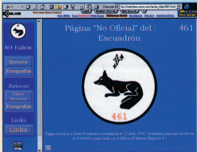
La página web de los "zorros" de Gando, o lo que es lo mismo del Escuadrón 461, incluye abundante información sobre esta sacrificada unidad.

Guerra Civil Española (área): www.aire.org/gce