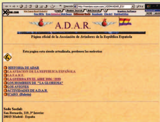
http://members.xoom.com/XOOM/ADARES/ Página oficial de la Asociación de Aviadores de la República Española.