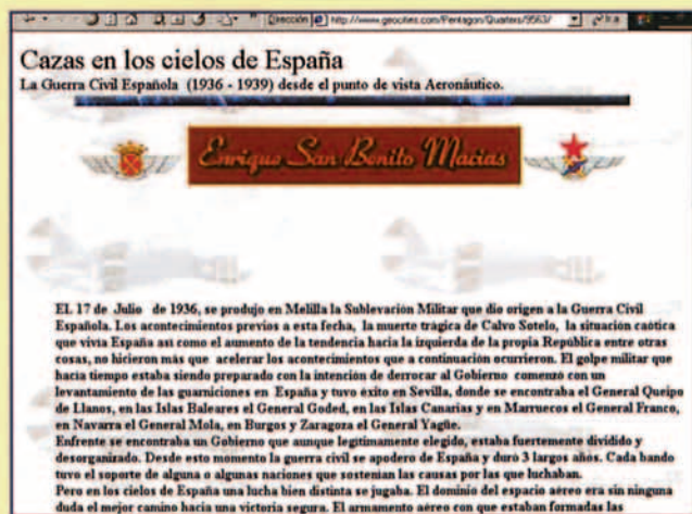
http://www.geocities.com/Pentagon/Quarters/9563/ Cazas en los Cielos de España: La Guerra Civil desde el punto de vista Aeronáutico.