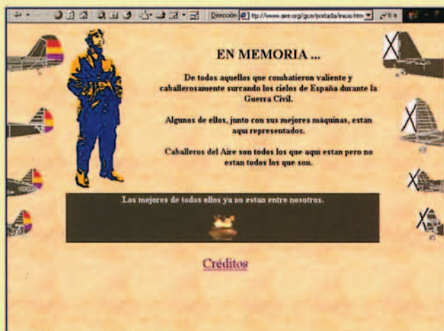
http://www.aire.org/gce/ Caballeros del Aire: Un homenaje a todos los que lucharon caballerosamente en uno y otro bando.

El material más representativo de la aviación republicana fueron los cazas de origen soviético "Polikarpov". El biplano I-15 "Chato" o "Curtiss" según lo apodasen republicanos o nacionales y el monoplano I-16 "Mosca" o "Rata" tienen su espacio en la red y en español de la mano de