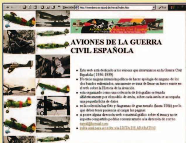
http://members.es.tripod.de/mrv/index.htm Aviones de la Guerra Civil Española por Manuel Rodríguez Valverde