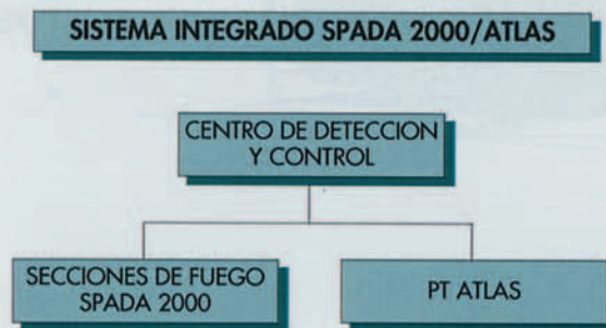
Organigrama nº 2

Esta misión debe considerarse dentro de un concepto general de operaciones de defensa aérea en el que los sistemas SHORAD complementan a los sistemas SAM y a los interceptadores, constituyendo la última línea de defensa contra las formaciones atacantes.