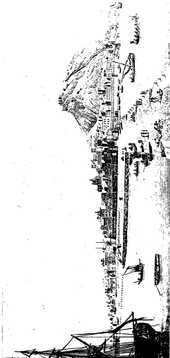
Vista general de ALICANTE.

Vista de Alicante. Grabado del siglo XVIII. (Museo Naval, Madrid).