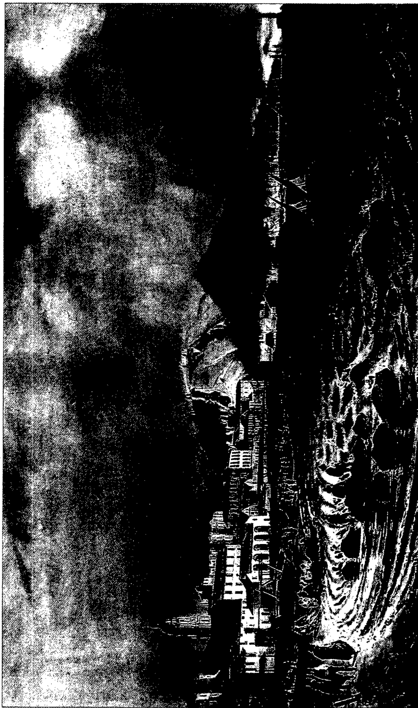
Vista del puerto de Málaga.