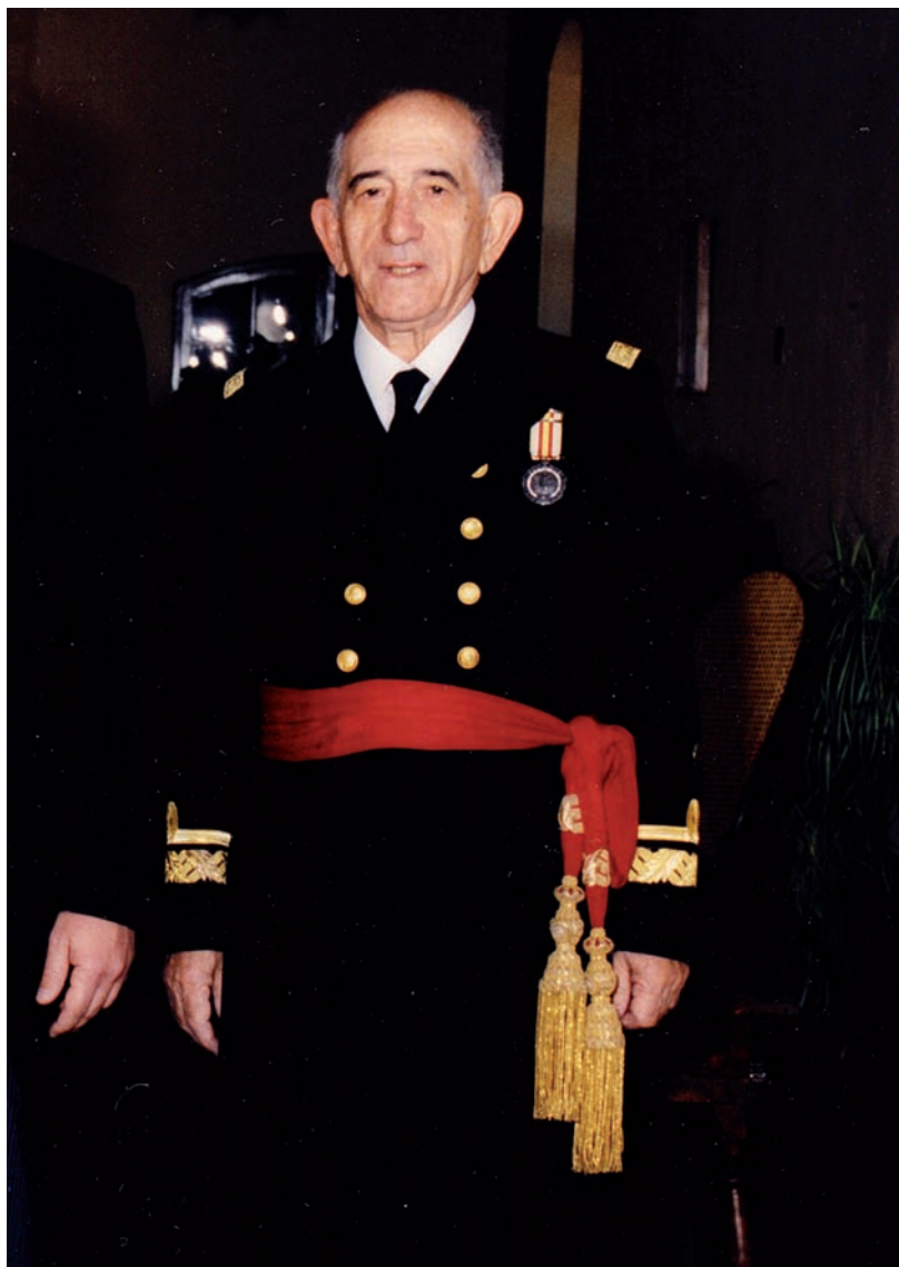
Retrato del Contralmirante Colorado Guitián