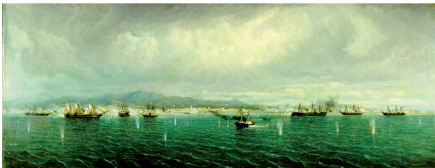
Bombardeo del Callao (1866)