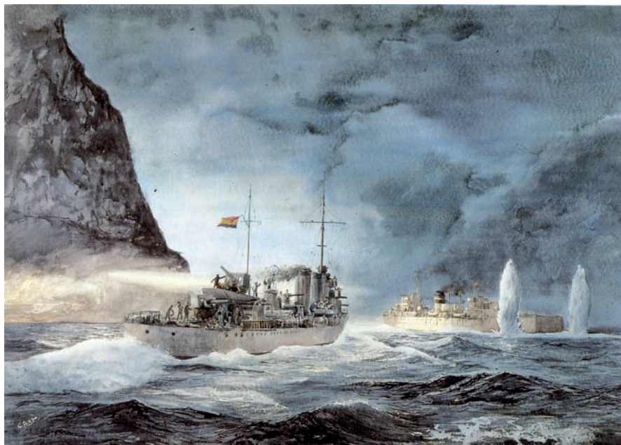
Combate del Vulcano y el José Luis Díez

A partir de los iniciales 33 personajes identificados en la lápida puesta por el vicealmirante Torres en la Escuela Naval Militar, concluidas nuestras pesquisas hemos pasado a conocer con precisión los nombres y circunstancias de nada menos que 319 marinos laureados: 12 grandes cruces laureadas; 2 cruces laureadas de cuarta clase; 37 cruces laureadas de segunda clase; 10 cruces sencillas de tercera clase; y 256 cruces sencillas de tercera clase (más dos carlistas). Y, además, otras 156 cruces dadas a personal del Ejército, paisanos y marinos extranjeros, por hechos de mar. Y, dado que el vigente Reglamento de la Orden incluye entre sus miembros a todos los condecorados con la Medalla Militar individual (que desde 1918 sustituye a las cruces sencillas de tercera y primera clase de la Orden de San Fernando), hemos formado también las relaciones de los marinos condecorados con esta preciada condecoración al valor: 32 con la Medalla Naval individual (y doce colectivas), 58 con la Medalla Militar individual (y 8 colectivas), y 4 con la Medalla Aérea individual.