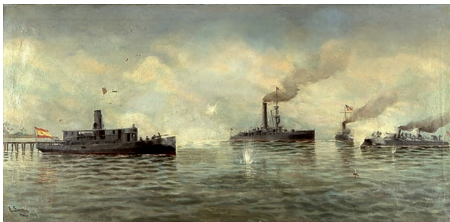
Acción del puerto de Cárdenas (1898)

En cuanto a los héroes laureados de 1898 en Cavite y en Santiago de Cuba (Cadarsó, Morgado, Lazaga, Bustamante, Villaamil, Carlier y Sánchez), son sobradamente conocidos. Pero no lo es tanto que no todo fueron derrotas: en la acción del puerto de Cárdenas, el 11 de mayo de 1898, el pequeño remolcador Antonio López , armado de urgencia con un cañoncito de tiro rápido y puesto al mando del teniente de navío don Domingo Montes Regüefeiros –justamente laureado por este hecho–, derrotó y puso en fuga