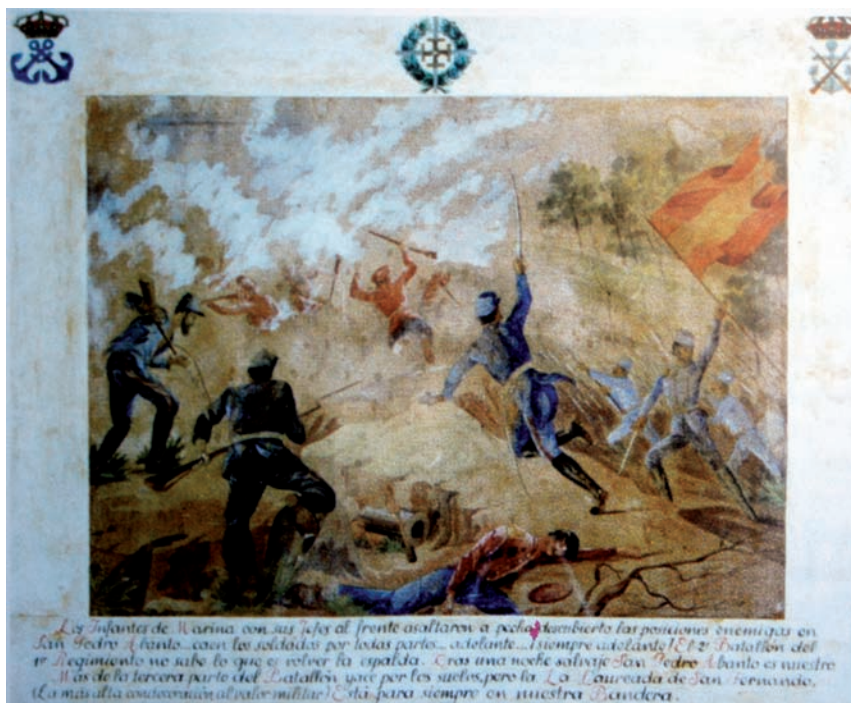
Combate de San Pedro Abanto (1874)

En la villa y puerto de Portugaleta ganó la cruz de San Fernando, el 11 de enero de 1874, el teniente de navío de primera clase don Tomás Olleros Mansilla, comandante de la goleta Buenaventura : allí hostilizó con todos los medios de su buque a los carlistas que sitiaban la villa, logrando prolongar trece días la defensa, hasta que, falto de municiones, destrozada la arboladura y el aparejo, con 32 impactos en el casco, haciendo agua y con inminente peligro de irse a pique, se vio obligado a forzar la salida por la ría bilbaina, maniobrando en un espacio de cien metros bajo un nutridísimo fuego de las baterías y trincheras carlistas que disparaban a menos de doscientos metros del buque, salvándolo a pesar de haber quedado sin gobierno en los más críticos momentos del lance.