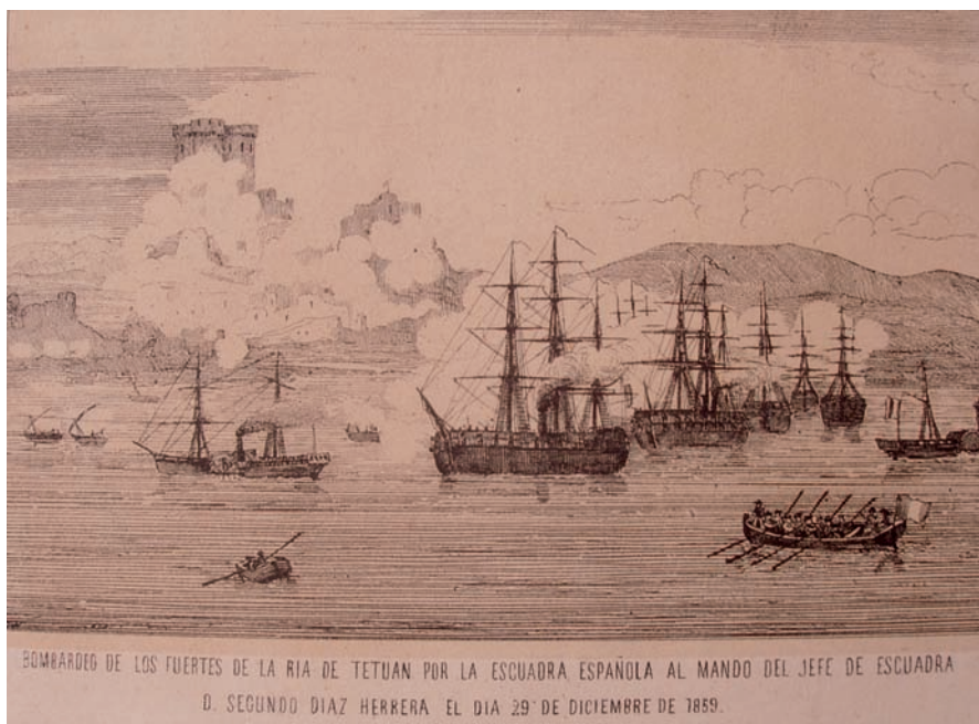
Bombardeo de Tetuán (1859)

ducido a los calabozos de Cartagena de Indias, sufrió la misma suerte que los demás prisioneros españoles, que perecieron en una masacre general. Pudiendo sobrevivir milagrosamente a pesar de estar casi degollado y con dieciocho heridas, y volver a España; pero hubo de llevar durante el resto de sus días –prolongados hasta 1854– un artilugio de hierro que le permitía llevar la cabeza derecha sobre los hombros.