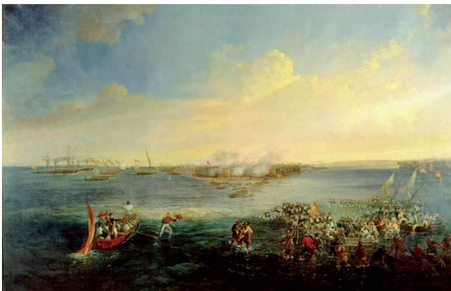
Toma de los fuertes de Balanguingui (1848)