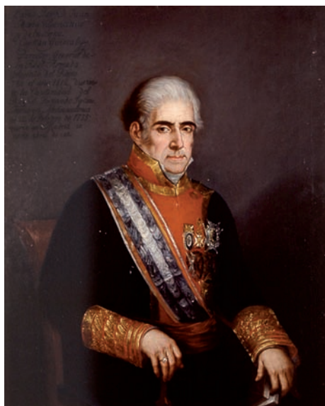
Retrato del General Villavicencio

Y, sin embargo, lo cierto es que el cariz marinero de la nueva Orden Militar creada en 1811 ha sido siempre muy neto, puesto que en sus reglamentos se han estimado ab origine , además de los hechos y acciones de guerra, los llamados hechos de mar , es decir aquellos actos de valor heroico realizados en el contexto de la secular lucha del hombre contra los elementos, incluso fuera de guerra declarada.