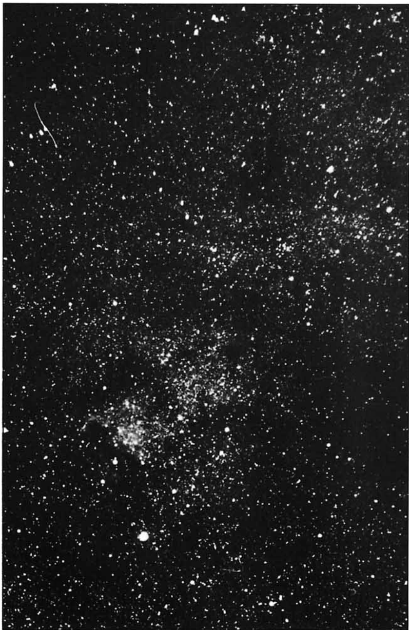
Desde hace años se investiga la posibilidad de entrar en contacto radiofónico con otros mundos.

Dando por favorables, dentro de una sólida probabilidad, los tres casos propuestos, el doctor Frank D. Drake, del Observatorio de Radioastronomía Nacional, cercano a Green Bank, en el Estado de Virginia Oc-