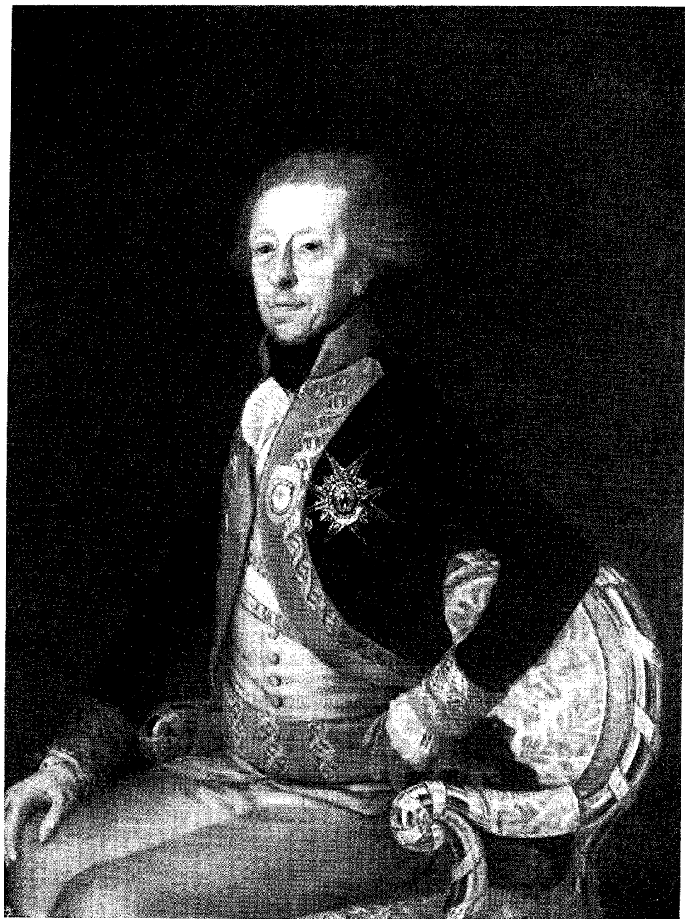
El General don Antonio Ricardos, por Goya. Museo del Prado (Madrid)