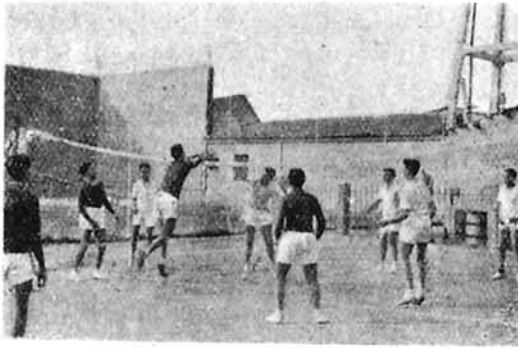
Jugando al balónvolea.

mientos que corresponden a cada una de ellas. Por medio de las clases prácticas, el alumno aprende a ejecutar perfectamente