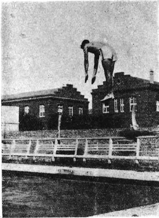
Un salto en la piscina de la Academia.

c) Estimular en el alumno el espíritu de compañerismo, decisión y coordinación de movimientos, así como el de propia superación por medio de diversas competiciones.