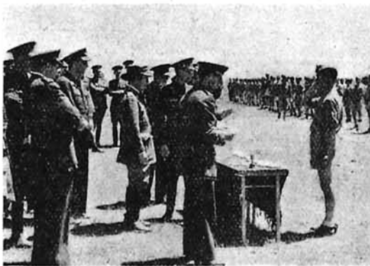
Entrega de premios deportivos en el Campamento de Ferral.

En lo que a deportes se refiere, se realizan competiciones de los siguientes: balompié, balonvolea, baloncesto, tenis en las