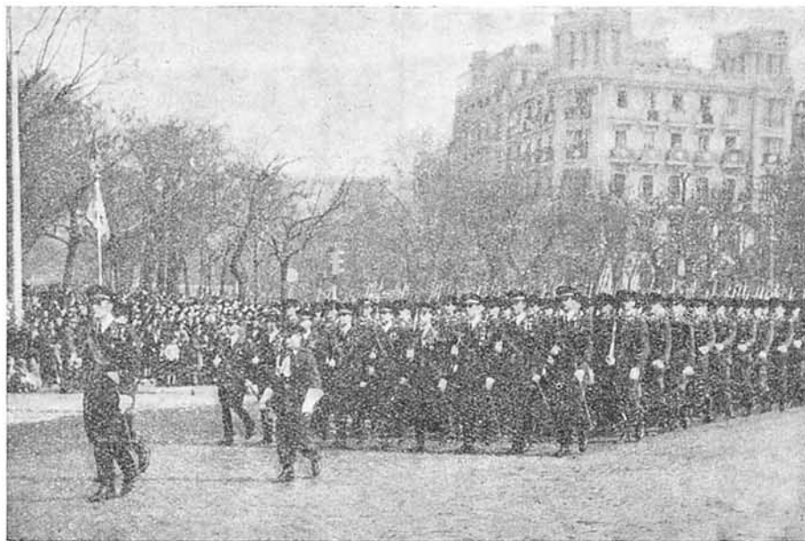
La isócrona uniformidad y corrección de movimientos, en el orden cerrado, son prueba de disciplina y adhesión al Jefe.

"Castigará sin cólera." Algo hemos dicho ya. Salvo los flagrantes delitos de insubordinación, nunca te dispares al castigar; medita un rato siempre antes de traducir en gritos, ni aun en palabras, no siempre todo lo serenas que exige un mando ecuaníme, la justa indignación que te produzca una falta; tranquilízate primero; ten por norma escuchar al que faltó, que tal vez baste la íntima violencia que un hombre honrado tiene que hacerse para justificarse, o la confesión sincera, para corregirlo, y siempre que recibas un parte por escrito, antes de resolver llama para escuchar a quien te lo dirigió, que al dar tiempo y lugar a la reflexión,