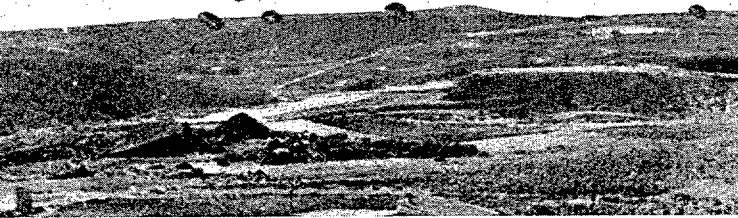
Envío de municiones y pertrechos a las tropas lanzadas sobre Creta.

Un Oficial inglés refiere: “En un solo aerodromo solamente, desde las diez de la mañana a las siete y media de la tarde, aterrizaron más de 400 aviones de transporte. Cada cuarto de hora llegaban diez de ellos, y las tropas que conducían salían inmediatamente para el lugar que les había sido de-