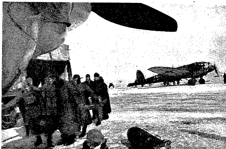
Carga de aviones de transporte con depósitos adecuados para su lanzamiento, los que para impedir el choque violento contra el suelo van provistos de paracaídas.

“...Vinieron los alemanes con sus aviones gigantes, y unos cinco de éstos tomaron tierra en las orillas de Katwijk y Scheweningen, al mismo tiempo que otros 50 lo hacían en las cercanías de Ijmuiden. Eran Junkers de transporte de tropas. Simultáneamente los paracaidistas ocuparon los aerodromos militares más importantes, mientras los aviones de transporte de tropas, cargados de ellas, aterrizaban incesantemente...”