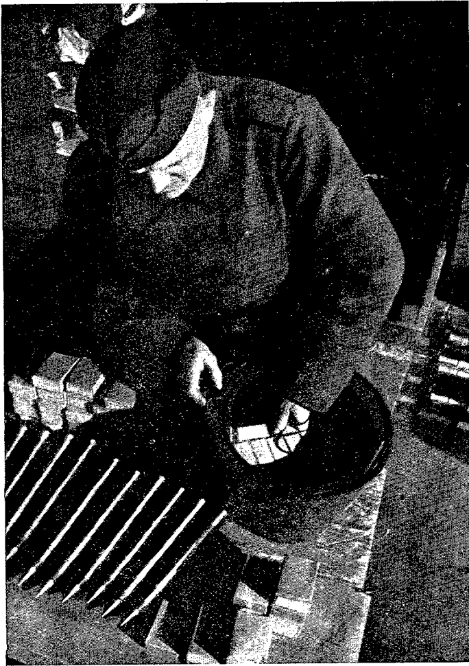
Soldado alemán llenando un depósito de municiones que ha de ser lanzado por los aviones de transporte.

El primero de estos ensayos consiste en aprovisionar a la China democrática, totalmente aislada con la ocupación de Birmania, mediante trenes aéreos que partan de los aerodromos del nordeste de la India y recorran los 2.000 kilómetros que hay hasta Chung-King. A este propósito dicen los técnicos yanquis que 200 aviones con una tonelada de carga y remolcando un planeador con dos, rinden igual que 300 camiones en la décima parte de tiempo.