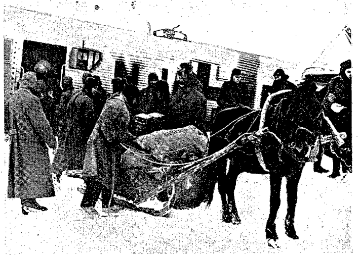
Toda clase de aprovisionamientos fueron enviados por avión a algunas fuerzas de las desplegadas en el frente del Este.

También en tal teatro de operaciones se ha probado la