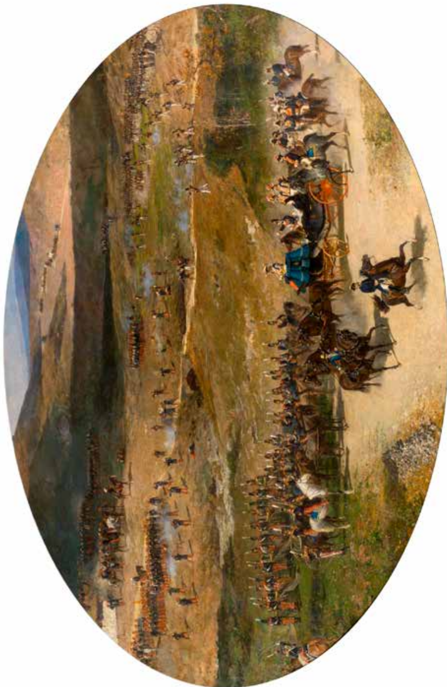
La reina María Cristina y su hija la reina Isabel pasando revista a las baterías de artillería que defendían Madrid en 1837. Cuadro de Mariano Fortuny, Museo del Prado.