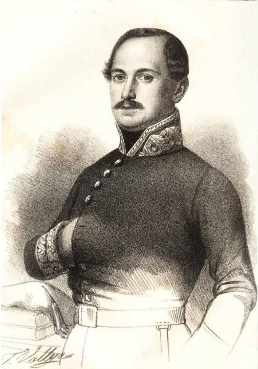
El general Zaratiegui, galería militar contemporánea