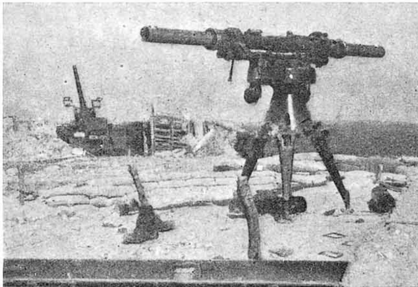
Un puesto de D. C. A. británico (cañón y telémetro) ocupado por el ejército alemán cerca de Abbeville.

Estas condiciones originan desgastes en los tubos, reduciendo la vida de éstos y trayendo como consecuencia el entubado necesario, debiendo prevenirse esta necesidad en su proyecto de fabricación y maniobra. La longitud de los tubos; la fuerte reacción a todas las elevaciones, que origina montajes especiales con frenos, recuperadores y compensadores de características determinadas, la necesaria fijeza de plataforma y anclaje, hacen que estos cañones sean mucho más pesados que aquellos de igual calibre de campaña. Pensar en que los cañones de campaña puedan algún día cumplir la dualidad de misiones terrestres y aéreas, es una utopía por ahora. El cañón de campaña ha de tener siempre mucha más movilidad táctica y más flexibilidad en sus trayectorias. Un cañón antiaéreo, tirando con ángulos menores de 10 grados, no sólo sufre en su montaje, sino que en cada disparo salta de su emplazamiento, perdiendo su orientación con respecto al director de tiro. No creo que en el momento presente se pueda abandonar la idea pura antiaérea, sobre todo teniendo en cuenta el aumento conside-