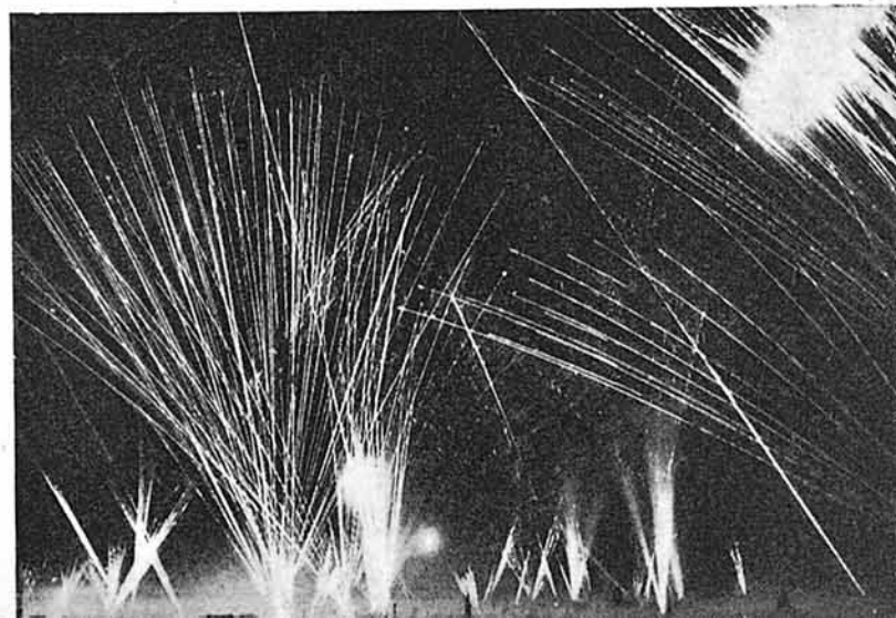
Un aspecto de la barrera establecida por la FLAK alemana durante un raid aéreo nocturno enemigo, en un lugar de la costa del Reich.

El empleo del Grupo para la defensa de objetivos, no de gran extensión, sino de gran importancia, tiene por finalidad, primero, el aumentar su eficacia, y segundo, dirigir el tiro mediante una acertada distribución de objetivos. La masa de Aviación que se presente puede adoptar formaciones en profundidad o frente; pudiera creerse que el empla-