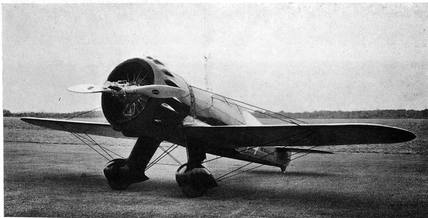
Monoplano de carreras Wedell-Williams , ganador de numerosas pruebas de velocidad. Provisto de un motor Pratt & Whitney , ha efectuado el viaje Chicago-Nueva York, de 900 kilómetros, a una media horaria de 503, velocidad superior a la de los records internacionales sobre base de 3 kilómetros y sobre base de 100 kilómetros.

La necesidad de impedir el que pueda atravesarse la hélice, limita la amplitud a dar al sector de percusión. En el Nieuport 52 se hace el reglaje con un sector de 12^\circ,5 , o sean, 25^\circ de recorrido de hélice. Puede verse en el gráfico, la influencia que tiene el sector de percusión en la elevación de la cadencia. En la Escuela de Los Alcázares se ha llegado a emplear hasta el sector de 19^\circ , máximo que permite el montaje de varillas en el Nieuport sin que se produjeran impactos en la hélice. La causa más importante de producción de éstos parece ser el estado de la munición y, sobre todo, su humedad. Otros aviones en los que el plano de giro de la hélice está más cerca de la boca del arma, permiten mayor sector y, por tanto, mayor elevación de cadencia.