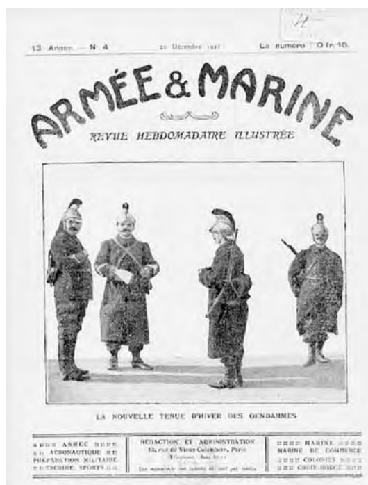
Figura n.º 1: Sección fija dedicada al oficial de complemento en la revista Armée & Marine , Francia.

parte del contingente movilizable. Dicha oficialidad fue, como se ha dicho, consecuyente y progresivamente implantada en toda Europa a lo largo del tramo que medió entre la Guerra Franco-prusiana y la Gran Guerra. Por ejemplo, en 1889, casi veinte años después de la derrota de Sedán, Francia tenía una reserva de 210.000 hombres, de los cuales, al menos, 7.000 eran oficiales de complemento. Más adelante, en 1899, las funciones de algunos de estos oficiales fueron ampliadas para poder ejercer como auxiliares de Estado Mayor –otra de las carencias francesas puestas de manifiesto en Sedán–. Sin duda, estas decisiones contribuyeron a la victoria de la coalición integrada por Francia –el bloque aliado– en la Primera Guerra Mundial 5 . Un ejemplo del interés por este tema y el grado de integración de estos hombres en su ejército es la sección fija dedicada al Officier de complément en la revista Armée & Marine francesa, según se muestra en la figura n.º 1. Una