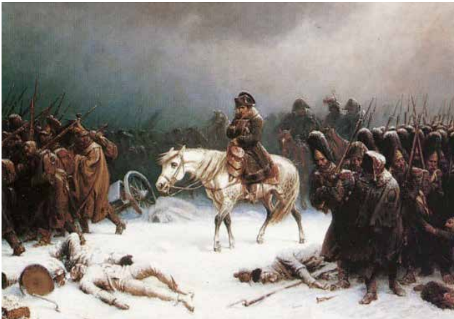
La retirada de Napoleón de Moscú. Adolph Northen

En el otoño de 1812 una larga columna humana de varios kilómetros de longitud se arrastraba penosamente por la estepa rusa en dirección a la frontera salvadora, una caravana tan inmensa que se alargaba hasta el infinito. Eran los restos de la Grande Armée de Napoléon, de aquellos más de 500.000 soldados que el 24 de junio pasado habían atravesado triunfantes el río Niemen, dispuestos a doblar al zar Alejandro.