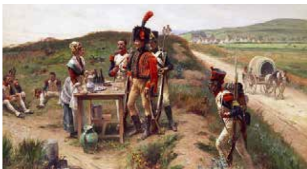
Soldados napoleónicos con una joven tendera. Adrien Moreau (1843-1906)

Concluida la guerra y firmada la paz, en la primavera de 1814 se produjo el regreso masivo de los prisioneros españoles de Francia, y, con ellos, sus mujeres, las “prisioneras” de Napoleón. Algunas habían pasado fuera de España más de siete años, siete largos años en los que sus vidas habían cambiado sustancialmente. Ahora, tocaba finalmente el retorno a la normalidad.