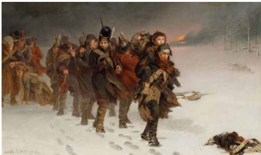
La retirada de Moscú. Laslett John Pott (1873)

El discurrir por la inmensidad desierta y helada era lento. Los hombres se movían despacio, como sombras, sorteando el frío, el hambre y la nieve que todo lo cubría. Cada uno marchaba aislado en su miseria, ignorando al vecino. Únicamente los juramentos y maldiciones al cielo que, de cuando en cuando, se podían escuchar, daban testimonio de que se trataba de soldados, de hombres de carne y hueso, y no de fantasmas. Pero no solo se escuchaban las voces de soldados. En medio del sordo vocerío se distinguían también voces femeninas. Y es que, en medio de la larga columna de muerte, había también mujeres, y con ellas algunos niños, que con estoica resignación soportaban los sufrimientos de tan terrible marcha, compartiendo, como un soldado más, la suerte de sus compañeros de infortunio.