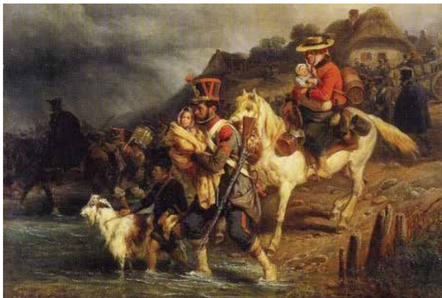
Un soldado ayudando a una cantinera y sus hijos a cruzar un río. Joseph Louis Hippolyte Bellangé (1837)

cluso años, acompañaron día a día, y con ellos conocieron también el dolor, la cautividad y la muerte. La fortaleza de esas mujeres, su estoicismo ante los peligros y las pruebas que hubieron de soportar, sorprendían a los soldados. Las había incluso, como decía el sargento Bourgogne, que “eran una vergüenza y una afrenta para muchos de los hombres que no sabían soportar la adversidad con el mismo coraje y resignación” 21 .