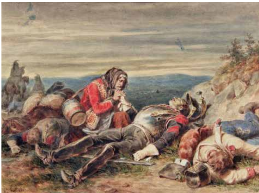
La Vivandière de Wagram. Hippolyte Bellange (1862)

de “ánimo permanente”, compartiendo con ellos su misma suerte y los sinsabores e ingratitudes de la vida en campaña 30 . Y, en el momento último, tras la batalla, de la recogida y el cuidado de los heridos 31 .