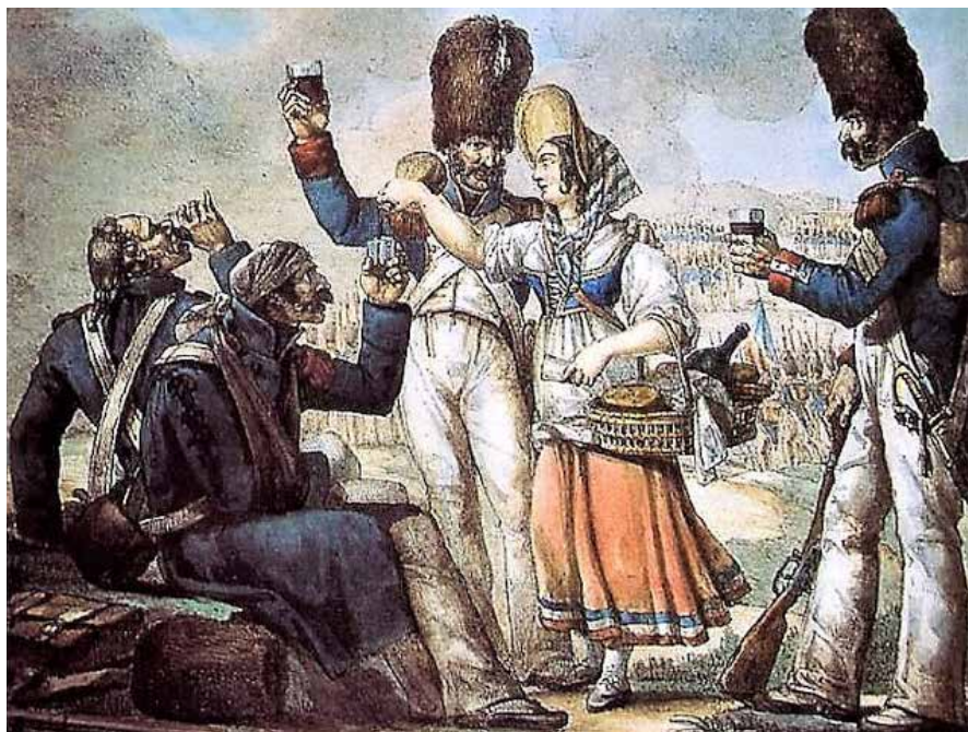
La lavandera. Jean Henri Marlet y Charles Philibert de Lasteyrie, París, Museo del Ejército

En los primeros tiempos, la cantinera solía ser la esposa del cantinero. Este hombre era un comerciante de comestibles que seguía a los ejércitos, y que con frecuencia terminaba por establecerse en las plazas principales de los países conquistados, con autorización del comandante de la gendarmería. Su mujer le ayudaba en sus actividades comerciales, pero también se encargaba, mediante el pago de un dinero ajustado y previamente convenido, de preparar la comida de los suboficiales 9 .