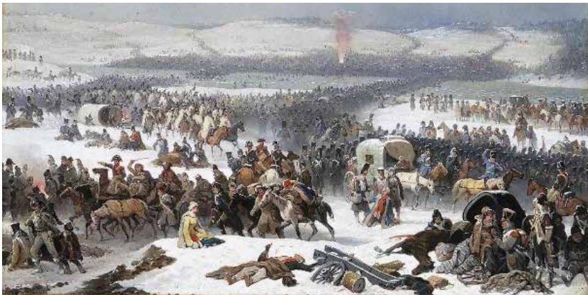
Napoleón cruzando el Berézina. January Suchodolski (1866). Museo Nacional de Poznan

Avanzaban con ellos, y sobrevivían en campamentos y vivaques levantados, las más de las veces, en algún país lejano. Algunas eran dulces, caritativas y piadosas, como la célebre Catherine Baland, del 95 de Línea, que en el combate de Chiclana, uno de los más mortíferos de la guerra de España, recorrió infatigable durante toda la batalla cada una de las filas, ajena a la lluvia de balas y metralla, llevando a los soldados algo de beber para reanimarlos, mientras que amablemente les repetía: “ toma, bebe mi bravo soldado, ya me pagarás mañana ” 16 .