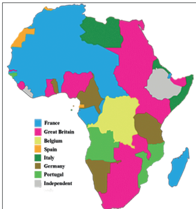
África colonial antes de la I Guerra Mundial

eran los nativos de la isla de Fernando Poo, aunque procedentes también del interior del continente; vivían de lo que producía la tierra y del trabajo de las mujeres; el alcoholismo, las epidemias y los malos tratos diezmaron a esta población durante el siglo XIX y el primer tercio del XX. En el sur de Fernando Poo había colonias de huidos de las islas portuguesas de Príncipe y Santo Tomé y a los que