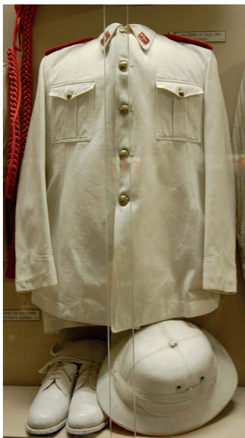
Uniforme de guardia colonial. (Foto del autor: Museo Histórico de la Guardia Civil).

Finalmente, el R.D de 12 de diciembre de 1907, que contiene el proyecto de presupuesto del año 1908 para la Colonia, en su Sección 2ª dice que “ el actual servicio de Policía se suprime, así como también la compañía de Infantería de Marina del golfo de Guinea y el Resguardo de Aduanas, refundiéndose estos tres Cuerpos en uno solo, que se titulará Guardia colonial. ” Los mandos de la nueva organización serán procedentes de la Guardia Civil y la tropa la formará esencialmente personal nativo asentado en la isla (entre ellos los muy apreciados senegaleses). Con una