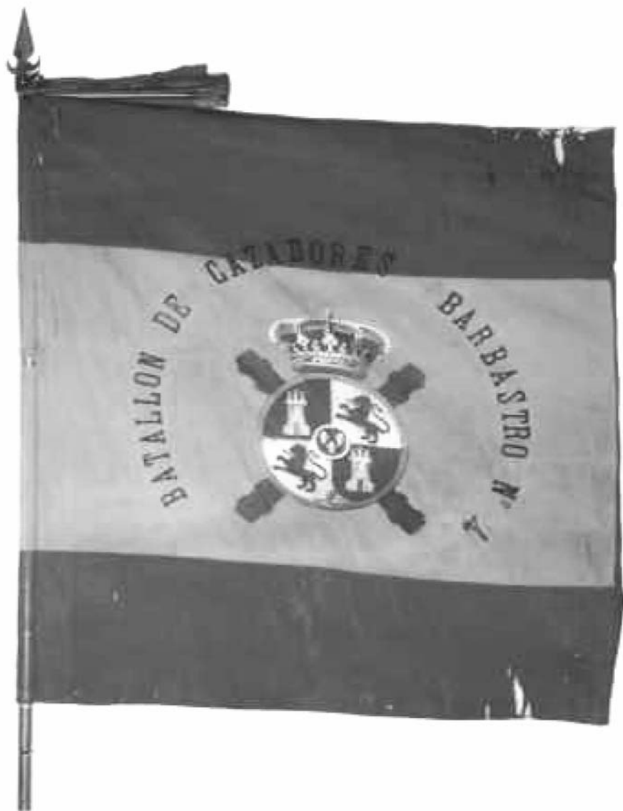
Bandera del Batallón de Cazadores de Barbastro n° 4 (1.899-.1.920).