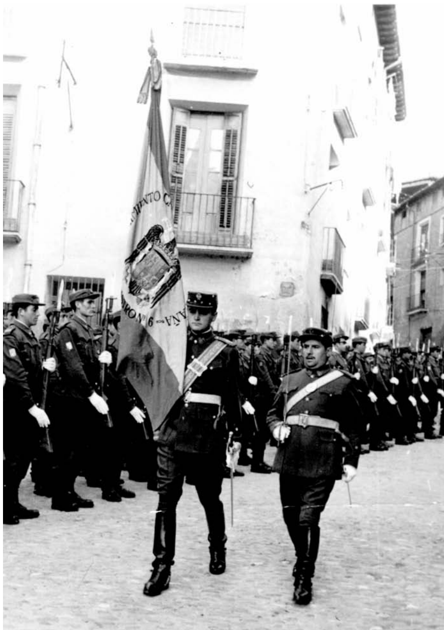
Bandera del Batallón de Cazadores de Montaña Motorizado “Barbastro” XVI. En sus pliegues figura la leyenda: REGIMIENTO DE CAZADORES DE MONTAÑA BARBASTRO Nº 6. Barbastro, 8 de diciembre de 1964.