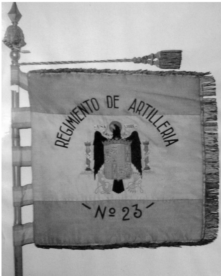
Estandarte ofrecido por la ciudad de Barbastro al RA. nº 23.