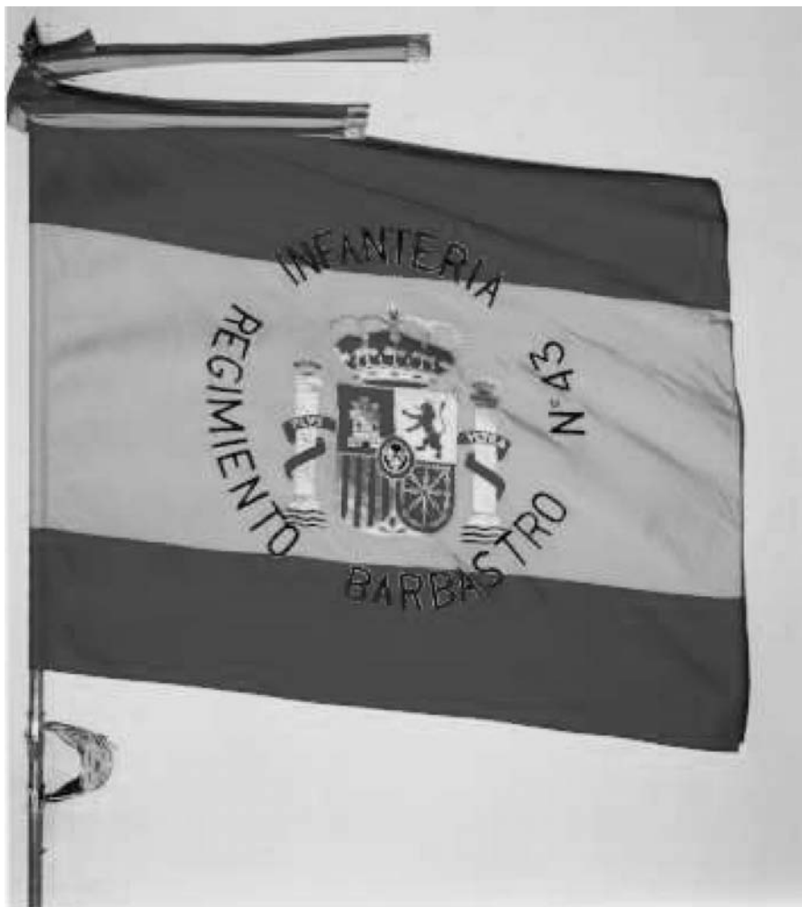
Bandera del Regimiento de Infantería Barbastro nº 43 (1983-1986).