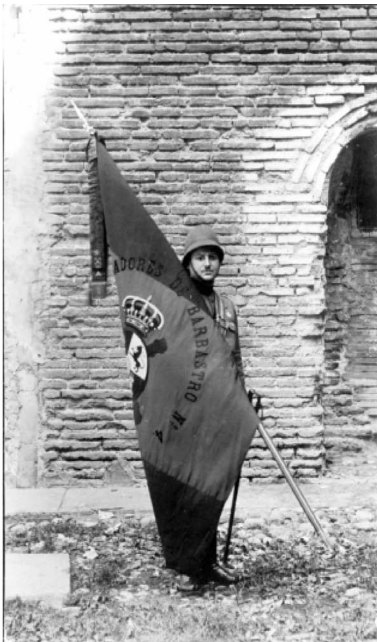
Bandera ofrecida por la ciudad de Barbastro. Día 7 de septiembre de 1.920.