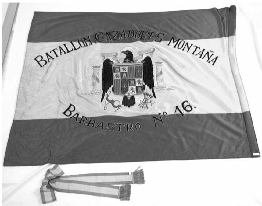
Bandera del Batallón de Cazadores de Montaña “Barbastro” nº 16 (1.943-1.946). Bandera reutilizada, pues perteneció anteriormente al Regimiento de Infantería nº 62.