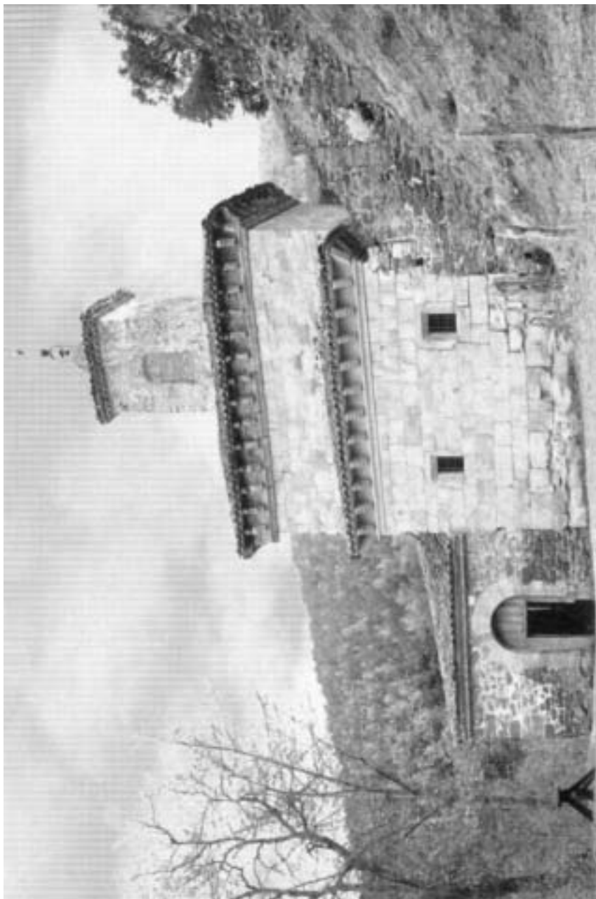
Monasterio de San Millán de la Cogolla (Suso)