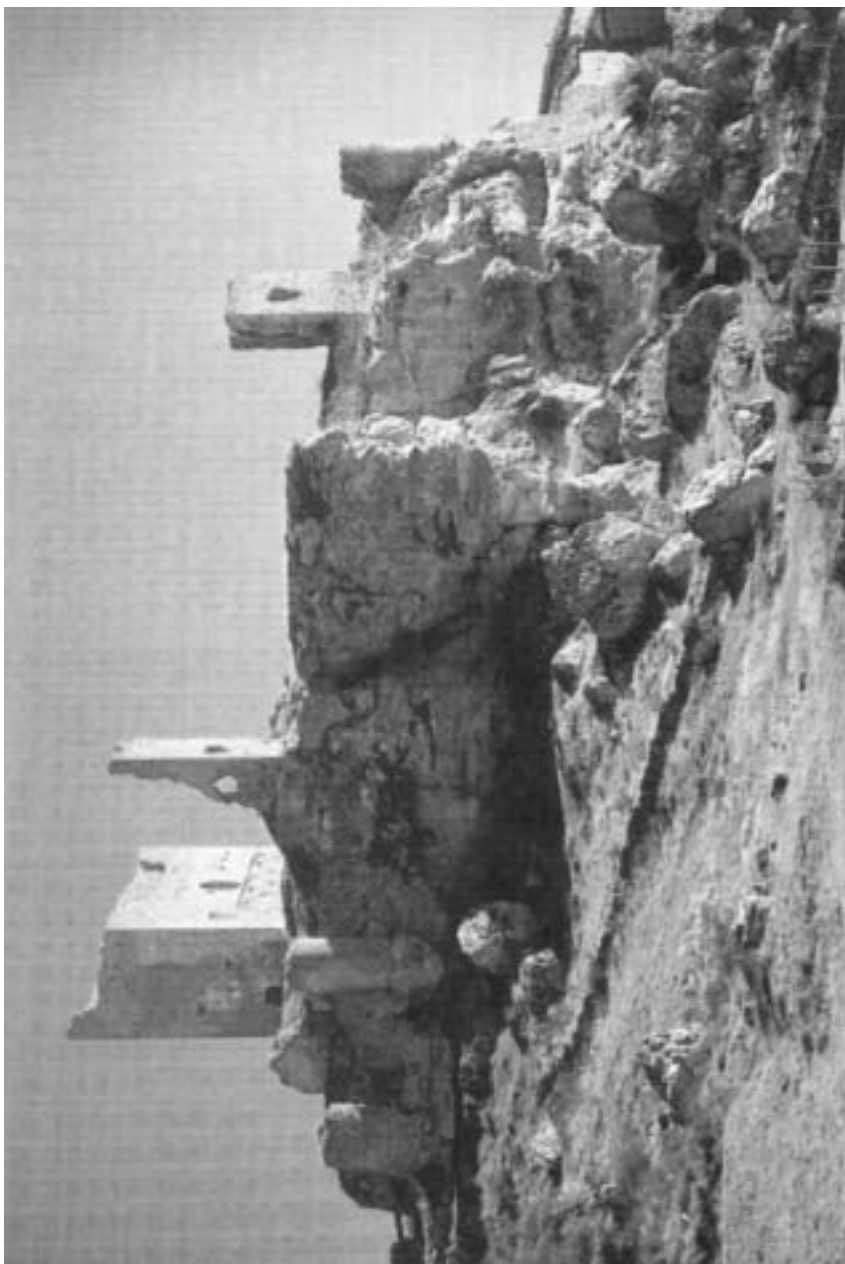
Ruinas del Castillo de Calatañazor