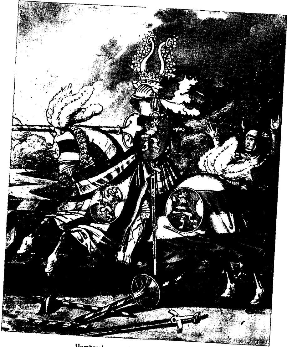
Hombre de armas de la Baja Edad Media.