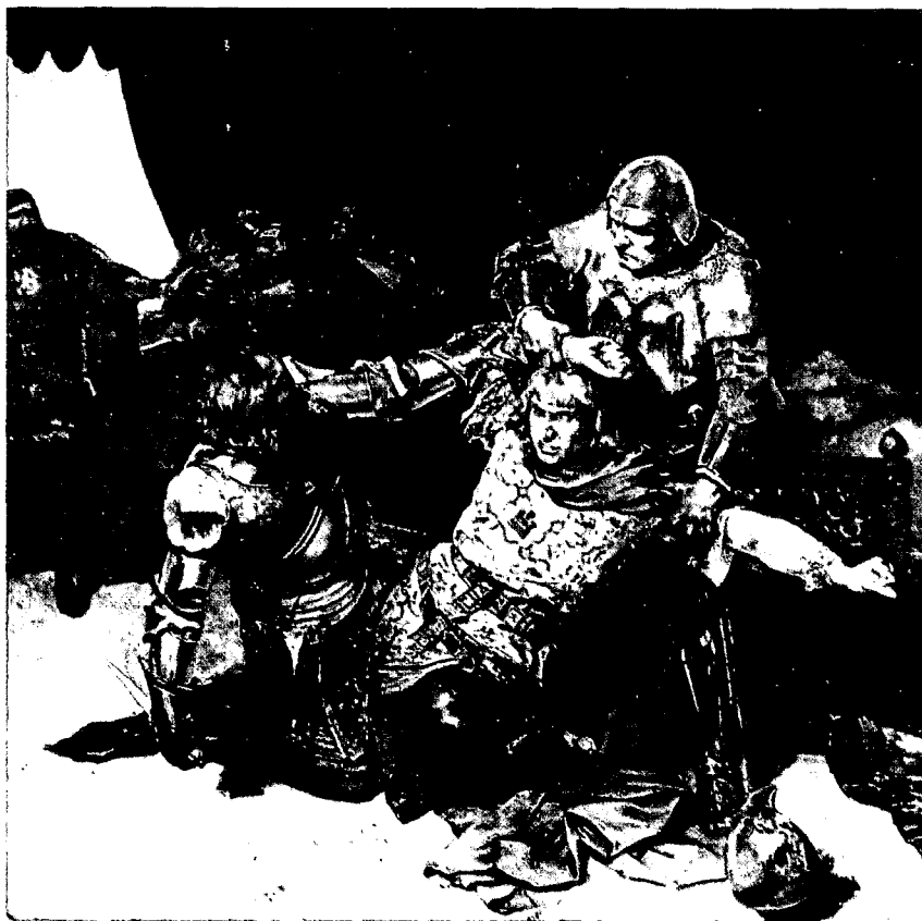
Don Enrique de Trastámara asesina a Pedro el Cruel (1369).