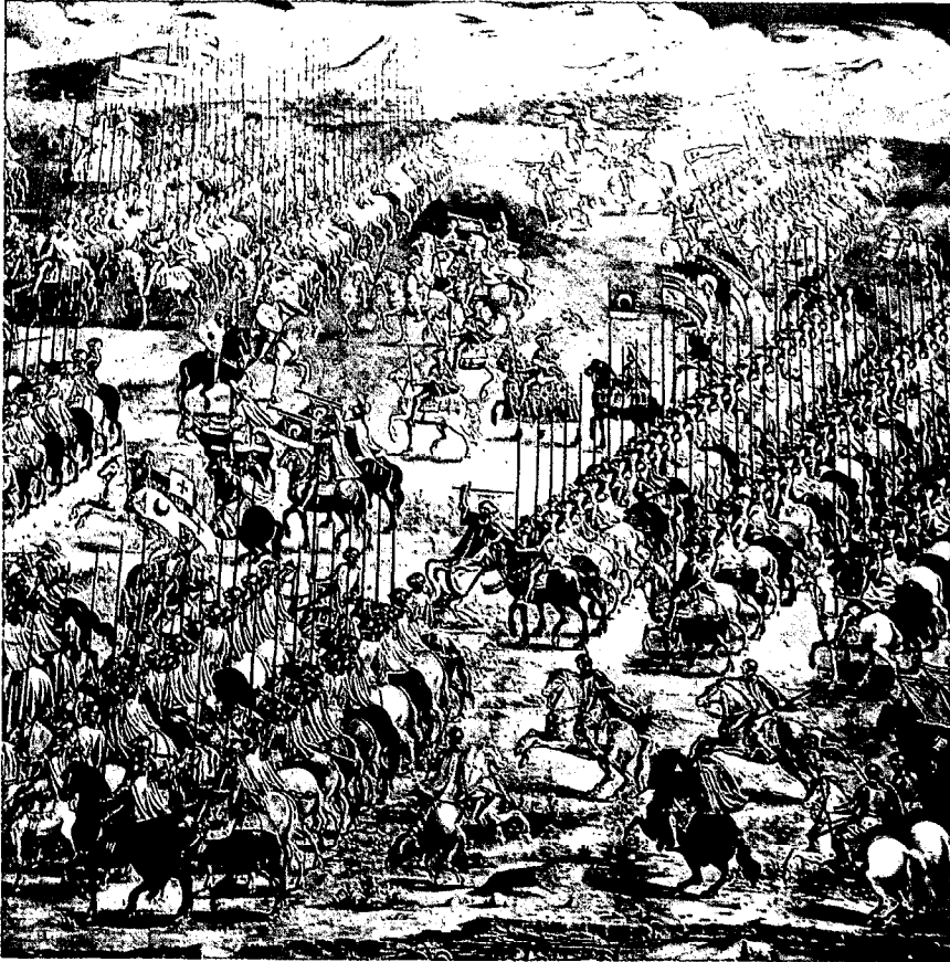
Batalla de Higuera (1431).