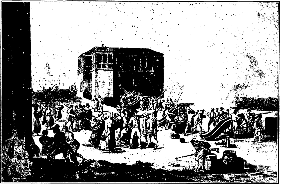
Batería de la Puerta de Sancho.