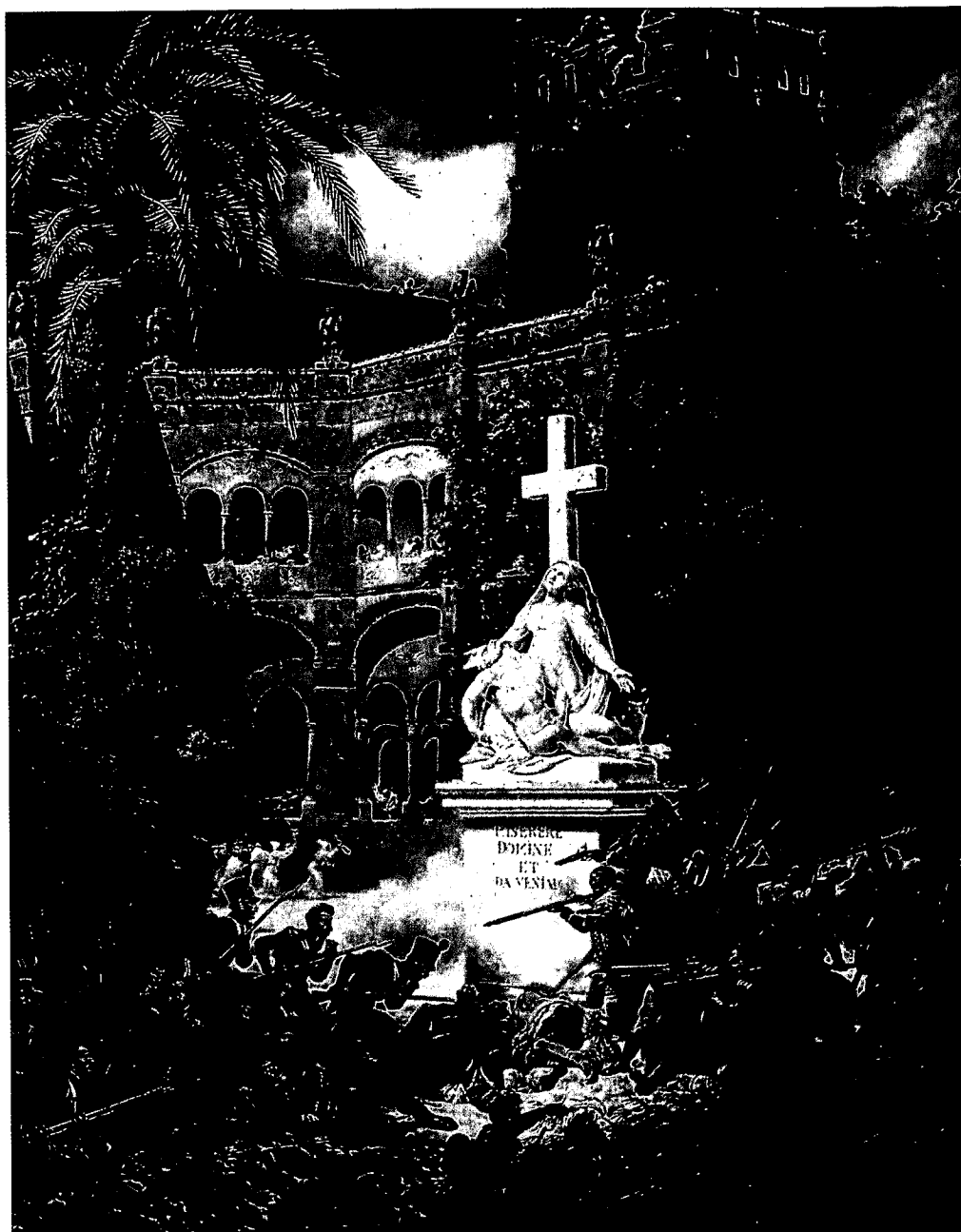
Defensa de la iglesia de Sta. Engracia por el pueblo de Zaragoza Cuadro de L. F. Lejeune (Museo de Versailles)