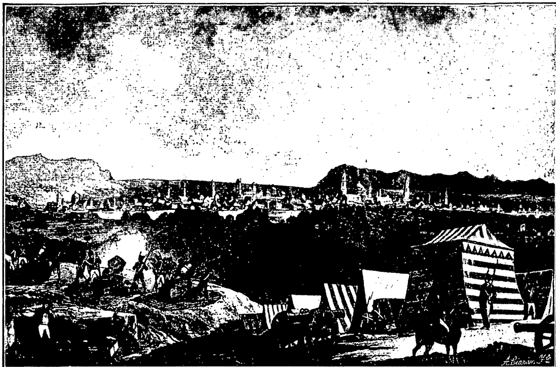
1808. — Vista general de la ciudad, tomada desde el monte Torrero, durante el primer sitio.