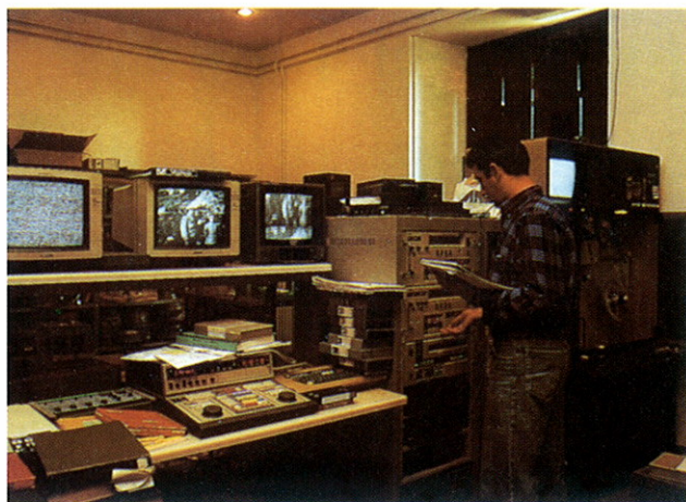
Área de tratamiento de documentos audiovisuales