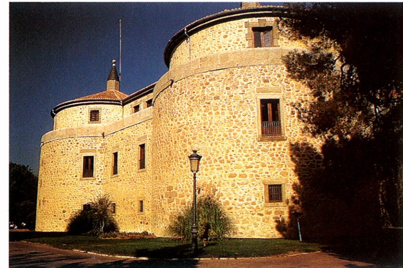
Castillo de Villaviciosa de Odón, sede del Archivo Histórico del Ejército del Aire