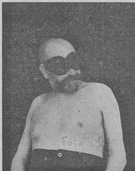
Fig. 1. a

Expondré primero el historial clínico de algunos de los enfermos por mí observados y tratados, y sobre esta base haré al final