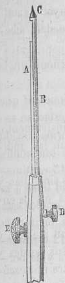
Fig. 4. a

Se compone de una varilla cilíndrica A B C dividida en dos mitades, una de las cuales B está fija al mango por el tornillo D, y la otra A se pone en movimiento sobre la primera por medio del tornillo E. Se introduce el instrumento cerrado á la manera del troacar explorador, cuya forma tiene; despues se abre, y cogiendo el fragmento de tejido entre la muesca que forma la separacion de las varillas, es dividida por los bordes cortantes de las mismas, encontrándose encerrado en una cavidad que hay en el interior de dichos extremos. Se retira entónces el instrumento, teniendo cuidado de no enganchar los tejidos al traves de los cuales ha pasado (1).