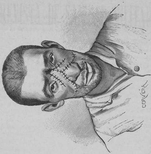
Figura 2. a

Disposición de los colgajos y de la sutura empleada para cerrar la abertura oval entrada del proyectil