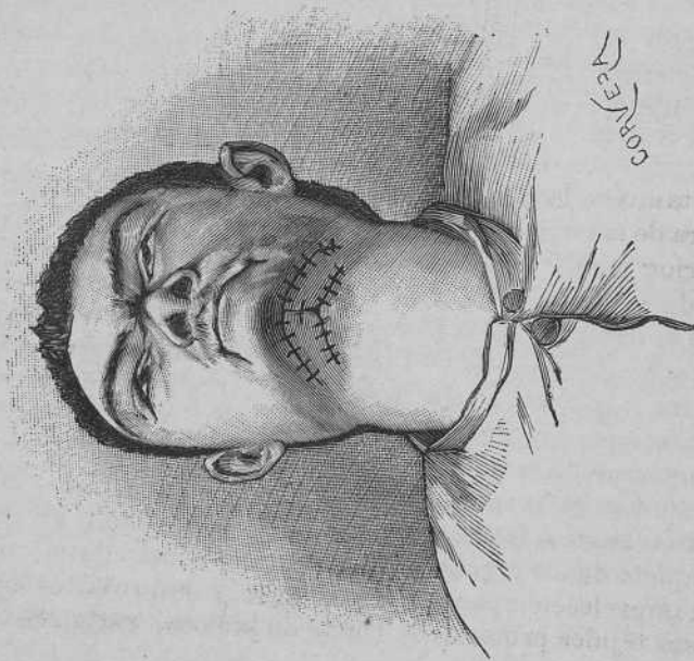
Figura 1. a

Disposición de los colgajos y de la sutura empleada para cerrar la abertura oval entrada del proyectil