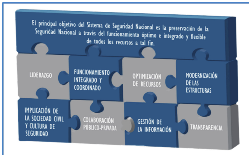
Figura 2. Estrategia de Seguridad Nacional 2013

de seguridad y defensa debería revisarse en cada legislatura de acuerdo con la DDN y en línea con los objetivos de la política de defensa.