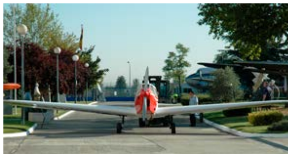
Llegada de la avioneta Santander

Para la exposición de aviones se ha optado por dos maneras diferentes de exhibirlos. Por un lado aparecen presentados en el suelo las aeronaves más grandes como son el Cuatro Vientos y el Plus-Ultra , debajo de las cuáles se han colocado lonetas simulando el mar sobre el que sobrevolaron estos aviones, mientras que el avión Jesús del Gran Poder aparece expuesto sobre tierra y césped artificial. Se completa la escena con una camioneta Ford , adquirida por el Museo en los años noventa, que fue usada como equipo de puesta en marcha de algunos