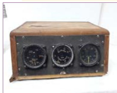
Instrumento-módulo de instrucción de vuelo

Estado de conservación: La caja es de madera blanda laminada y barnizada. Tiene perfiles de madera más dura en la parte superior e inferior, en la parte inferior los ha perdido, exceptuando el perfil del lateral derecho. El frente es de metal y las esferas del anemómetro, variómetro y altímetro son también de metal y con cristal. El laminado en la parte superior de la caja se ha perdido (queda un pequeño fragmento). El resto del laminado está en muy mal estado con grandes zonas levantadas, pérdidas de lámina y manchas de humedad. El barniz está cristalizado por el paso del tiempo. Las patas son de caucho atornilladas a la base de la caja. El caucho está agrietado y cristalizado por el paso del tiempo.