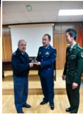
Fuerzas armadas República Popular China.