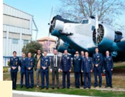
Entrega partitura Aire