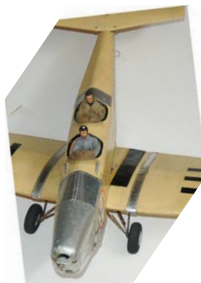
Maqueta de radio control