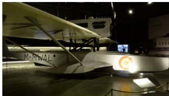
Después de la remodelación