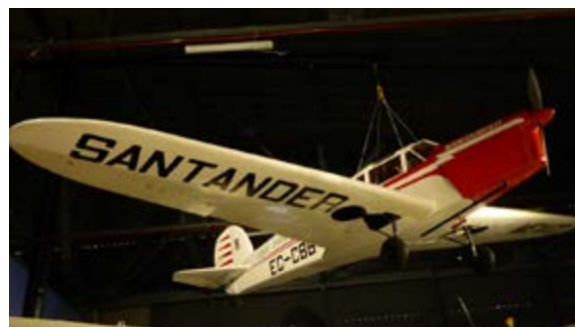
Avioneta Santander en posición actual

aviones en la época. Por otro lado las avionetas Santander y Ciudad de Manila , de menor tamaño que las anteriores, aparecen expuestas en el aire ancladas al techo con unas eslingas.