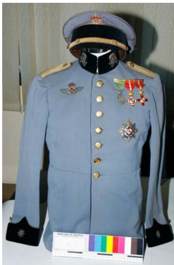
Uniforme comandante de Caballería

Mención especial dentro de esta donación, merece la hélice del avión Barrón Flecha , de 1917; a pesar de que entre las colecciones del museo se halla un extenso número de hélices de avión, no existe ninguna correspondiente al modelo de avión mencionado, de tal manera que esta hélice, que se encuentra en perfecto estado de conservación supone un testimonio notable del progreso tecnológico que supuso la navegación aérea.