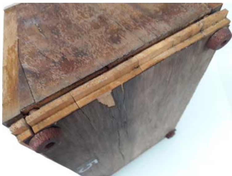
Después del tratamiento

Con estas premisas es imprescindible acometer un plan de restauración continuo que devuelva el valor que estas piezas y bienes aportaron a la historia de la aviación.