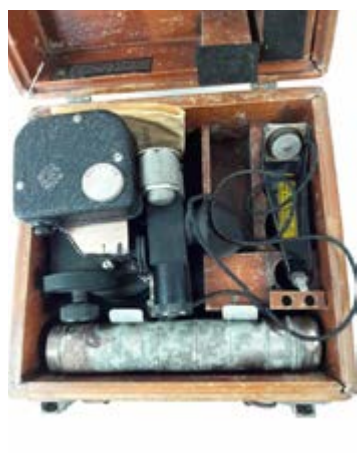
Vista interior del Sextante