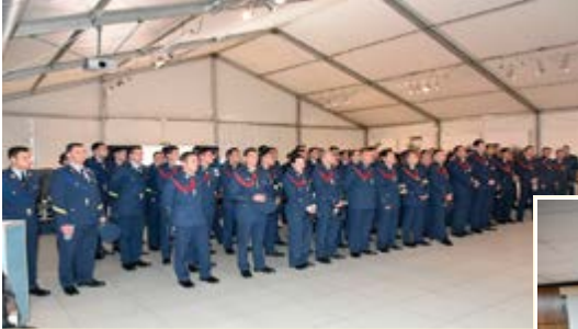
Escuela Técnicas Aeronáuticas

Durante este semestre el museo ha recibido diferentes visitas. En todas ellas, tras una breve bienvenida, se procedió a realizar una visita guiada por las instalaciones del mismo, entregándose a su finalización un recuerdo de su paso por estas dependencias.