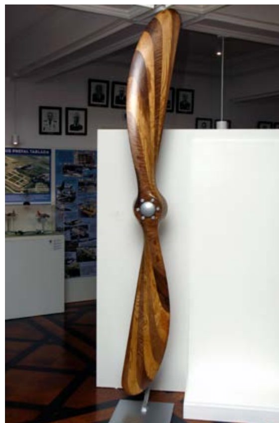
Hélice avión Barrón Flecha