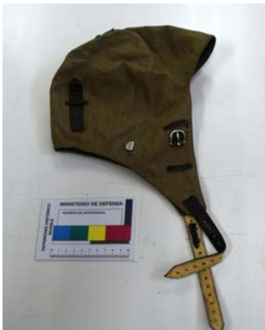
Gorro de Vuelo