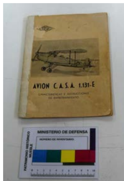
Manual Casa 1.131-E

Y por último, un manual de instrucciones correspondiente al avión C.A.S.A. 1.131-E . Este manual resulta de interés para el museo, puesto que uno de los aviones más fabricados y longevos de la historia, utilizado para el entrenamiento de pilotos, fue el Bü-131 "Jungmann", construido por la empresa alemana, radicada en Berlín, "Bücker Flugzeugbau GmbH". La versión española de este avión es el CASA 1.131-E, que fue una de las primeras series, montadas enteramente en España, al que en 1957, se le incorporó el motor ENMASA G-IVA "Tigre" de 125 cv. El Museo posee dos aviones de esta tipología y está a la espera de recibir otros 4 procedentes de AESA.