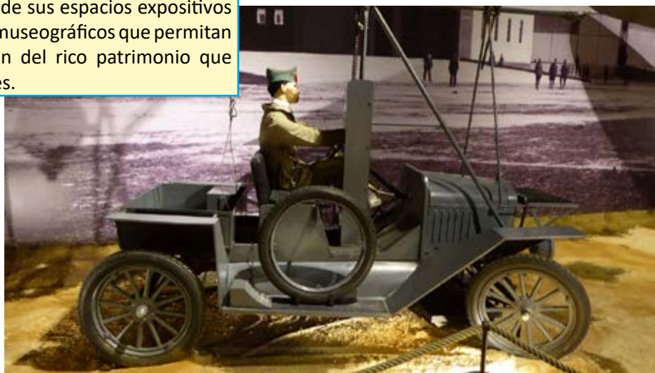
SISTEMA DE ARRANQUE HOTCHKISS. FORD-T

Con esta nueva remodelación, el Museo de Aeronáutica y Astronáutica avanza en el camino de la modernización de sus espacios expositivos con nuevos criterios museográficos que permitan la correcta exhibición del rico patrimonio que albergan sus hangares.