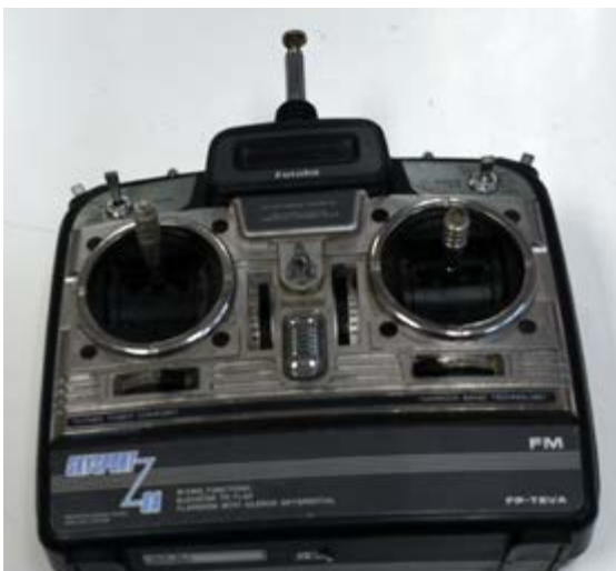
Emisora de radio control