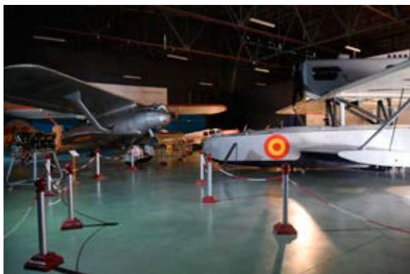
Antes de la remodelación