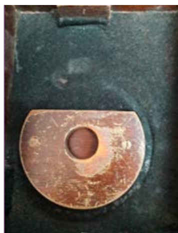
Detalle de la plataforma ya montada