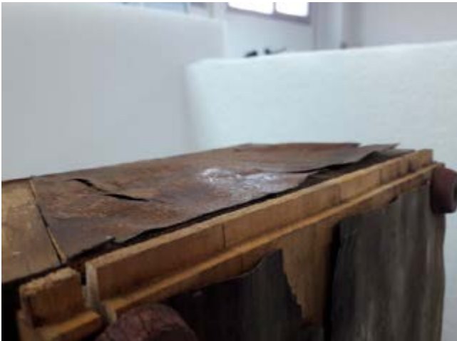
Antes del tratamiento