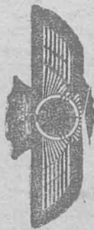
Emblema general para personal de tierra