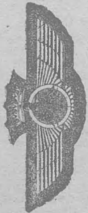
Emblema general para personal de vuelos