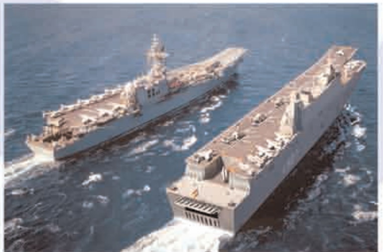
Fotomontaje del Buque LHD con el Principe de Asturias