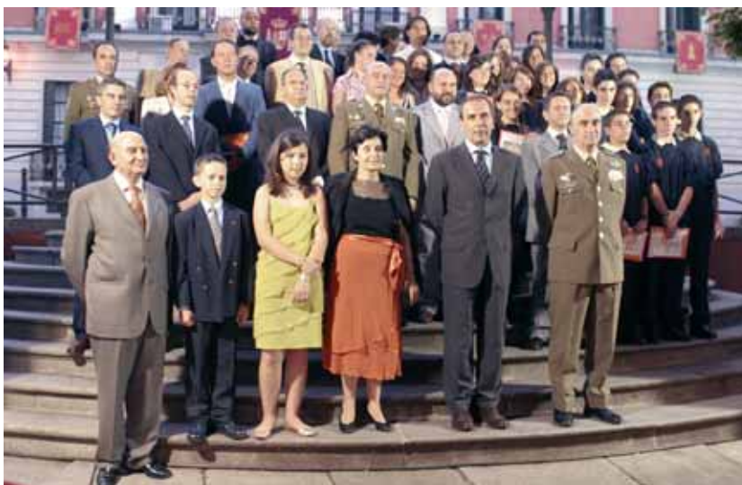
Los premiados en las diferentes categorías posan al finalizar el acto junto al titular de Defensa y el jefe del Estado Mayor del Ejército, general Villar.

Juan Moreno Aguado, Francisco José Lazo y Miguel Ángel Ferrándiz son los autores de las pinturas premiadas en esta edición. En sus obras muestran lugares vinculados a la vida de los militares o aspectos de su trabajo, al igual que sucede con las fotografías. Los ganado-