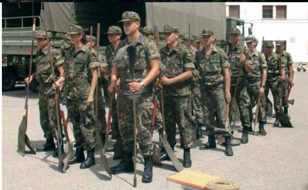
Un retén de la Comandancia General de Baleares se prepara para participar en labores de apoyo durante la última campaña contra incendios.

A principios de junio, el Consejo de Ministro prorrogó el Plan de Actuaciones de Prevención y Lucha Contra los Incendios Forestales aprobado en 2005. Esta decisión se ha adoptado porque la Unidad Militar de Emergencias (UME), creada a finales del pasado año con el propósito de ser uno de los principales instrumentos del Estado en la lucha contra el fuego, no iniciará su actividad hasta el año 2007, una vez que resulte operativa con la cobertura, al menos, del 50 por 100 de su estructura y el desarrollo de los procedimientos necesarios de instalación y adiestramiento del personal. No obstante, el acuerdo