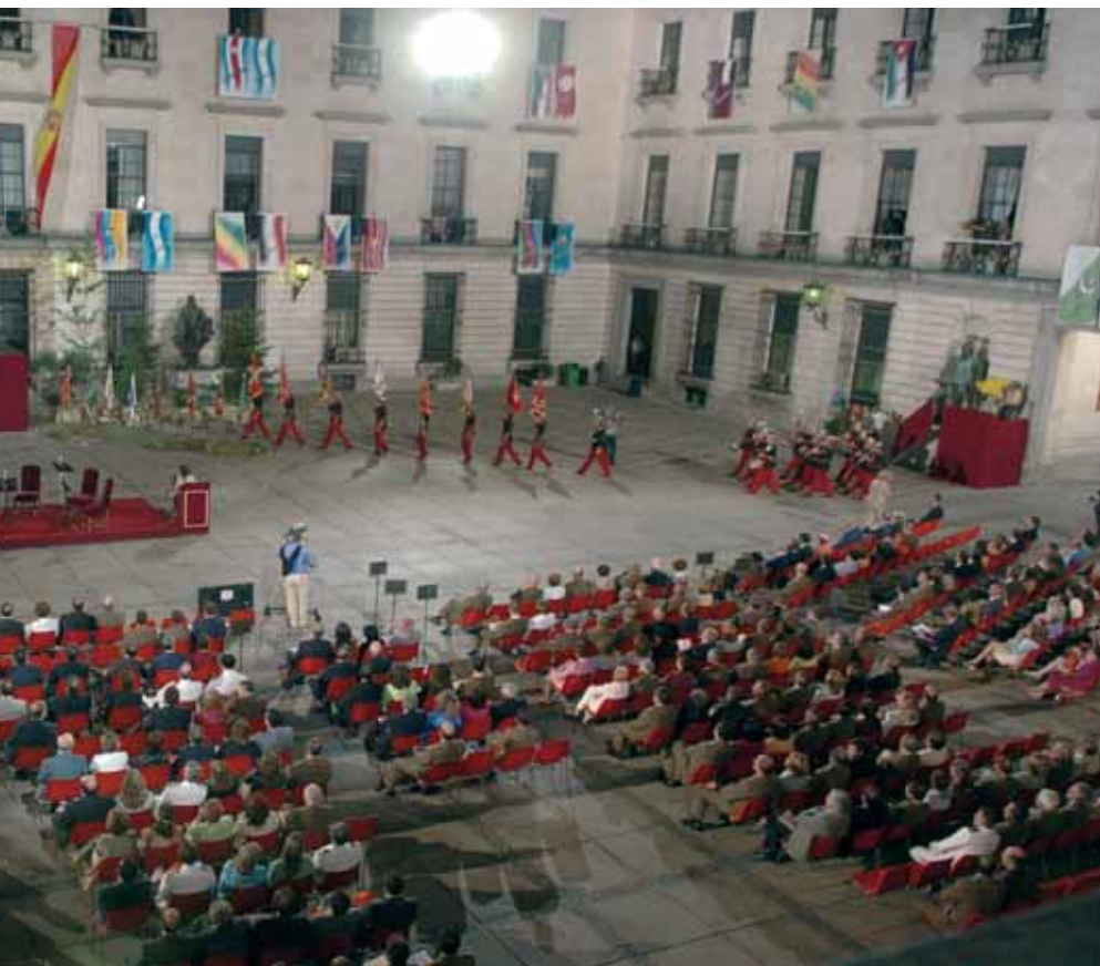
M. A. Romero/DECEP