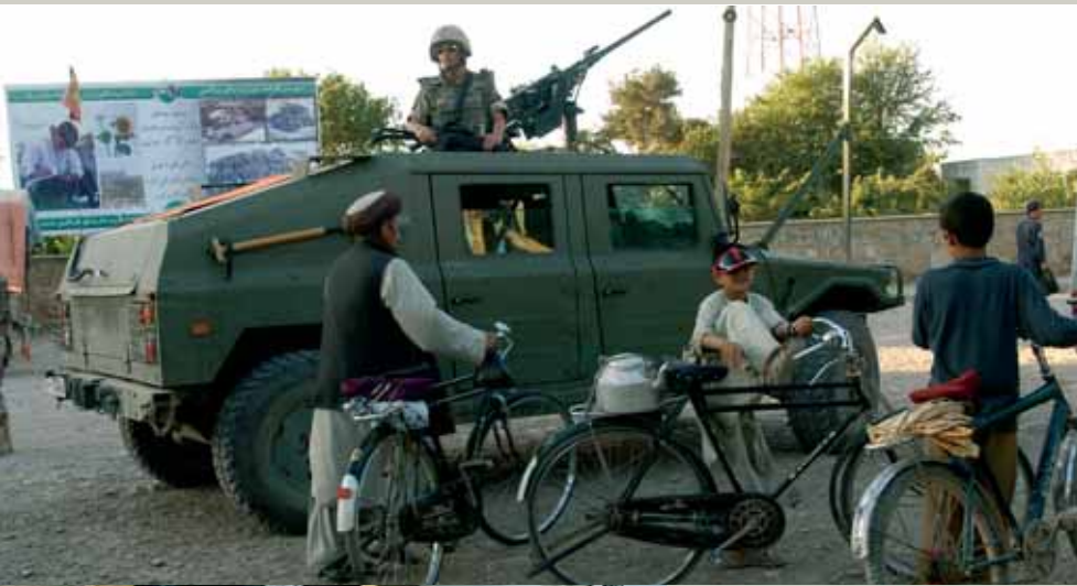
Patrulla española en un vehículo de alta movilidad táctica (VAMTAC) en una calle de la capital de Badghis.