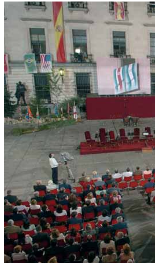
El patio del Cuartel General fue escenario de la entrega de los Premios Ejército 2006.