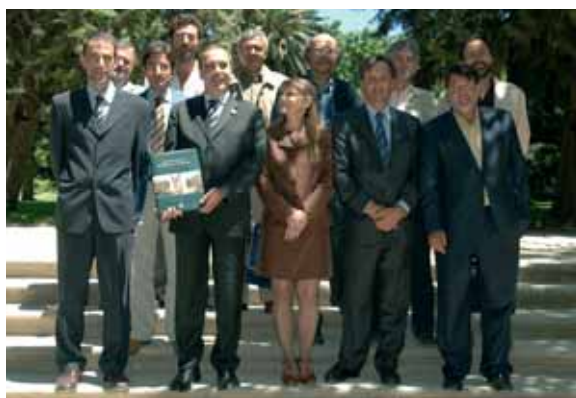
El ministro de Defensa, el presidente del CSIC y los autores muestran el libro tras su presentación en el Botánico.