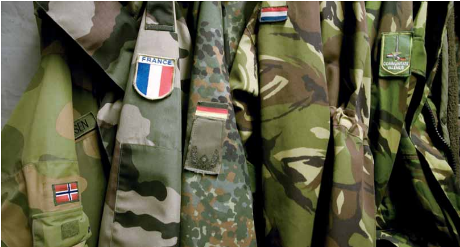
Tres Divisiones aliadas del Eurocuerpo —la de Operaciones Aeromóviles de Alemania, la 6ª Noruega y la 4ª Francesa— participaron en este ejercicio.