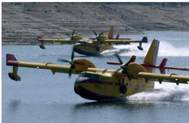
Dos Canadair CL-215T cargan sus depósitos de agua en el embalse de El Atazar (Madrid) durante uno de los entrenamientos que realiza el 43 Grupo.