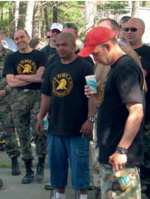
os que comparte su afición por la bicicleta.

despacho a donde puedo desplazarme andando o en bicicleta. Mi mujer se queda con el coche. Yo no lo necesito.