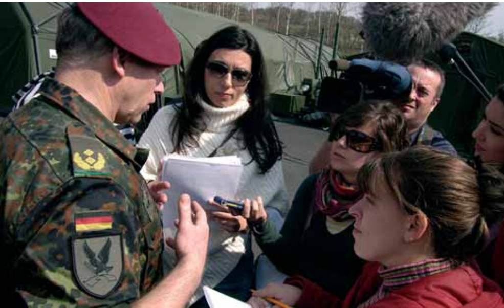
Un total de diez periodistas —cinco de ellos españoles— participaron en el ejercicio como parte del componente civil, integrado también por miembros de organismos y ONG.