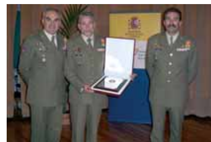
Ejército de Tierra

La EMMOE siempre ha tenido una especial vinculación con el fomento y desarrollo del deporte. De hecho, está dedicada a la formación del personal militar en las diferentes técnicas de Montaña y Operaciones Especiales . La Escuela se creó en