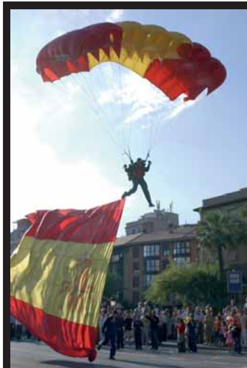
Con la llegada de la enseña nacional a la avenida Teniente Flomesta concluyó el ejercicio de la PAPEA.

Y, sobretodo, la Academia está representada a través de quienes, posiblemente, sean sus mejores embajadores: la Patrulla Acrobática del Ejército del Aire, la Patrulla Águila . Instantáneas de sus maniobras, su mono de vuelo o la maqueta de uno de sus C-101 , han atrapado la atención de no pocos visitantes, que también han podido observarlos en el Mar Menor y estar con ellos en una firma de pósters en un popular centro comercial, también sede, del 30 de mayo al 3 de junio, de la exposición fotográfica itinerante España en el exterior .