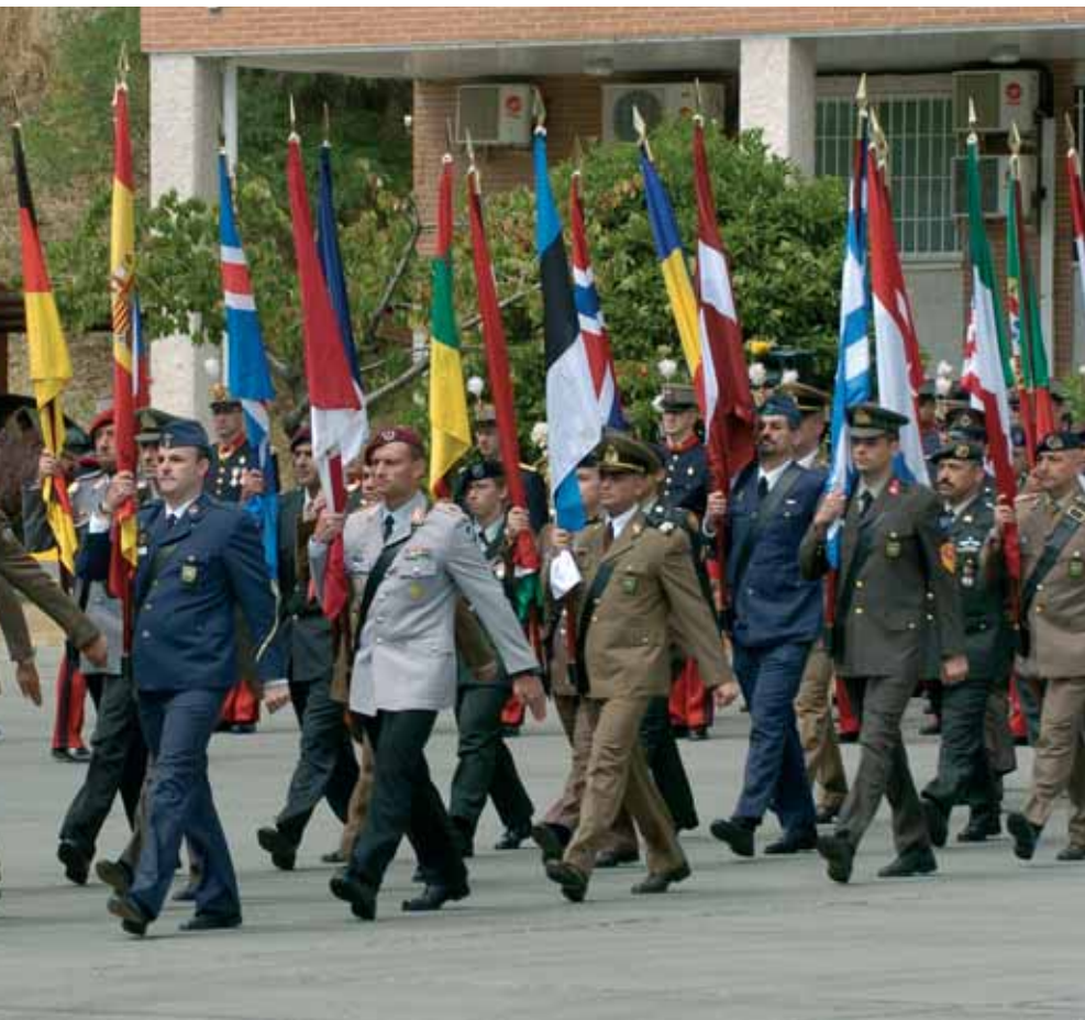
Países integrados en el Cuartel General de Retamares, en Madrid, desfilan frente a las autoridades.

Navarro subrayó también su esfuerzo por apoyar los procesos de entrada e integración de nuevas naciones a la OTAN ( Hungría, Bulgaria, Rumanía y Eslovenia) y la colaboración permanente con los países de la Asociación para la Paz, el Diálogo Mediterráneo y la Iniciativa de Cooperación de Estambul, así