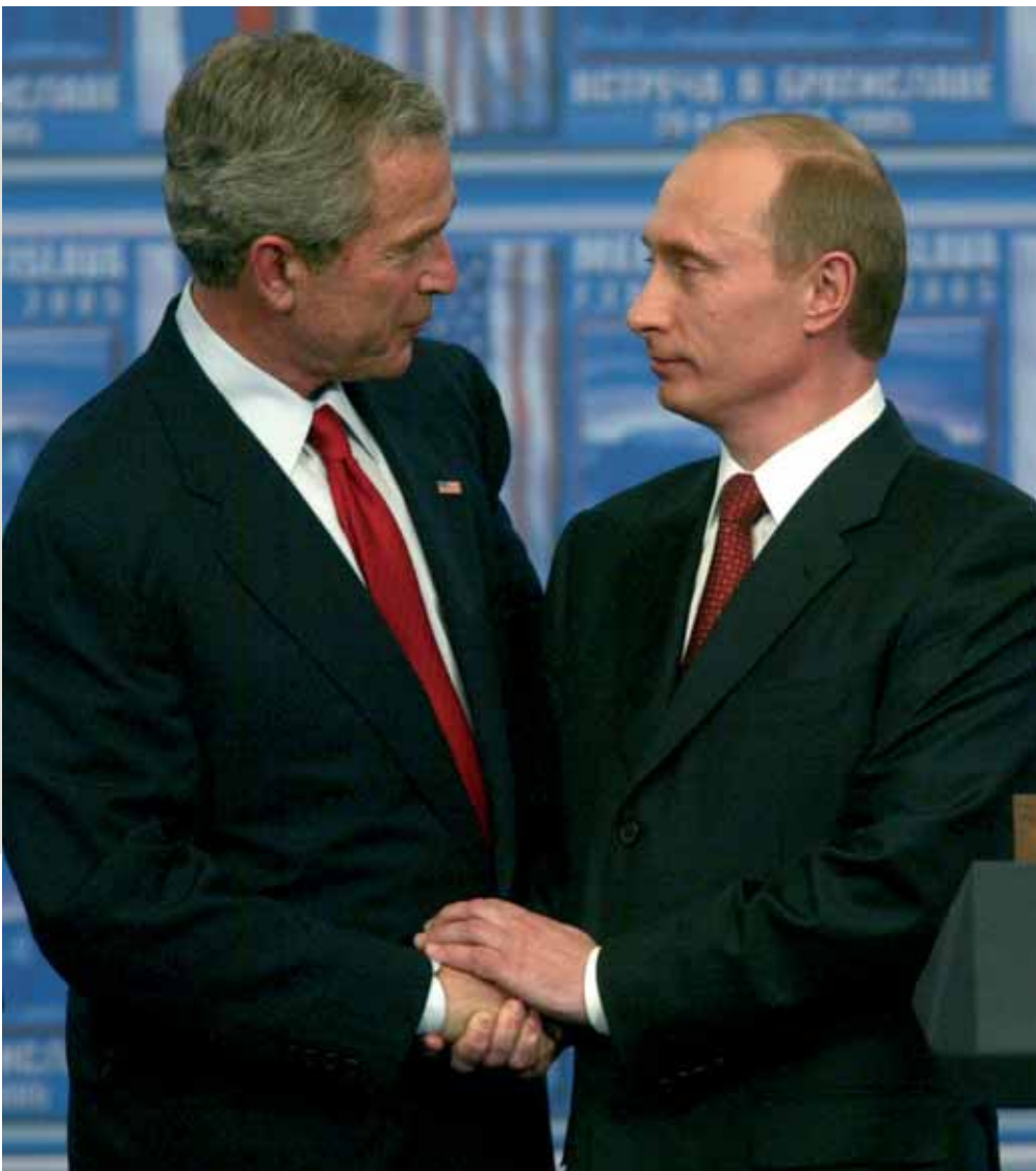
Los presidentes de Estados Unidos y Rusia, George Bush y Boris Yeltsin durante la última cumbre entre los dos países celebrada en febrero de 2005 en la ciudad de Bratislava.

petróleo y gas desde la zona del Caspio, con Azerbaiyán y Kazajistán como principales abastecedores, mediante un gasoducto que llegaría a suelo polaco a través de Ucrania, y se está retocando un plan para extender el oleoducto Odesa-Brody hacia Plotsk y Gdansk.