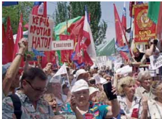
Ciudadanos de Kiev se manifiestan en contra de la posible adhesión de Ucrania a la Alianza Atlántica.

pude desvincularse del distanciamiento político. Pero los problemas de la adhesión no son menores, empezando por las fronteras. Hasta ahora, entre Rusia y Ucrania no existen límites fronterizos efectivos y bien delimitados. Entrar en la OTAN supondría para Ucrania tener que fijar rígidamente la separación geográfica con Rusia, algo difícil de llevar a la práctica porque provocaría muchas tensiones. Ambas partes disputarían por muchas franjas de territorio que pasarían a ser consideradas estratégicas o de interés histórico propio. Además, millones de personas que trabajan ahora a uno u otro lado de la frontera, podrían perder su trabajo y muchas familias tendrían que separarse.