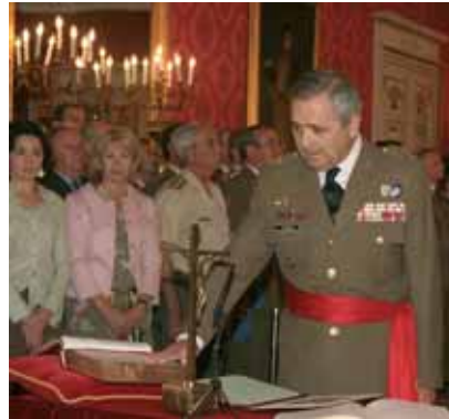
Ejército de Tierra

De 61 años y natural de Madrid, el nuevo segundo JEME era hasta su nombramiento, jefe del Mando de Personal del Ejército de Tierra (MAPER). Procedente del Arma de Artillería , ha estado destinado, entre otras unidades y organismos, en la Brigada Paracaidista, las Fuerzas Aeromóviles del Ejército de Tierra