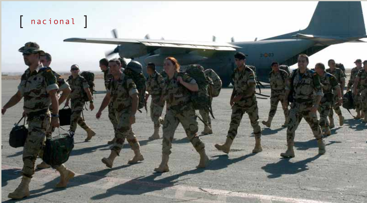
Integrantes del nuevo contingente español destacado en Afganistán a su llegada a la Base de Apoyo Avanzada de Herat.