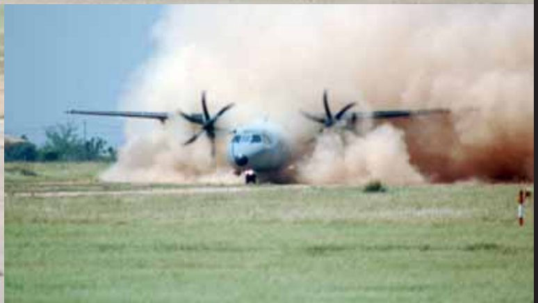
El JEMAD (Izquierda) presenció una evacuación de personal no combatiente. El comando desciende del helicóptero, toma posiciones para proteger la llegada del avión y el embarque de los civiles y, finalmente, se repliega de nuevo en el helicóptero.