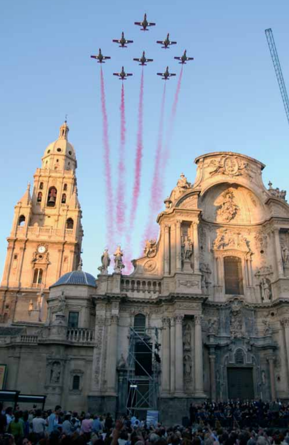
La Patrulla Aguila sobrevoló la catedral de Murcia en los primeros compases del concierto de la Unidad de Música de la AGA y el orfeón Fernández Caballero . Abajo, los asistentes a la exposición de la base de San Javier siguen también los ensayos de los equipos acrobáticos.