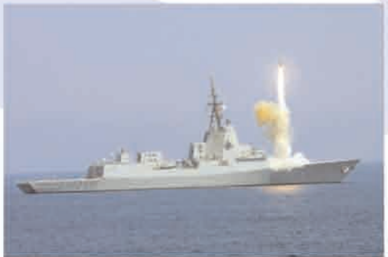
Fragata F-100 lanzando un misil