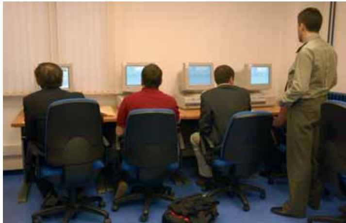
Los aspirantes al reingreso realizan las pruebas de aptitud en los centros de selección de tropa y marinería.

Oficial de Defensa (BOD) número 97, del pasado 19 de mayo. En la misma, se establece el procedimiento para la readmisión y se convocan un total de 209 plazas para militares de complemento —de las que 73 son para Cuerpos Comunes, 89 para el Ejército de Tierra, 23 para la Armada y 24 para el Ejército del Aire— y 1.620 para tropa y marinería —de las que nueve corresponden a unidades del Órgano Cen-