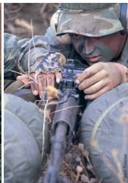
La UOE de Infantería de Marina, del MOE del Ejército de Tierra, del Escuadrón de Zapadores Paracaidistas y un tirador de precisión de la UOE.

demostrar la rápida capacidad de respuesta de las unidades especiales. Los asistentes vieron, por ejemplo, como se produjo el descenso a tierra de miembros de la unidad por el procedimiento de Fast Rope (rapel desde helicóptero). Quedó claro también el buen rendimiento de los aviones de transporte C-295 y C-212 Aviocar a la hora de efectuar tomas y despegues cortos y para operar en pistas que no están asfaltadas.