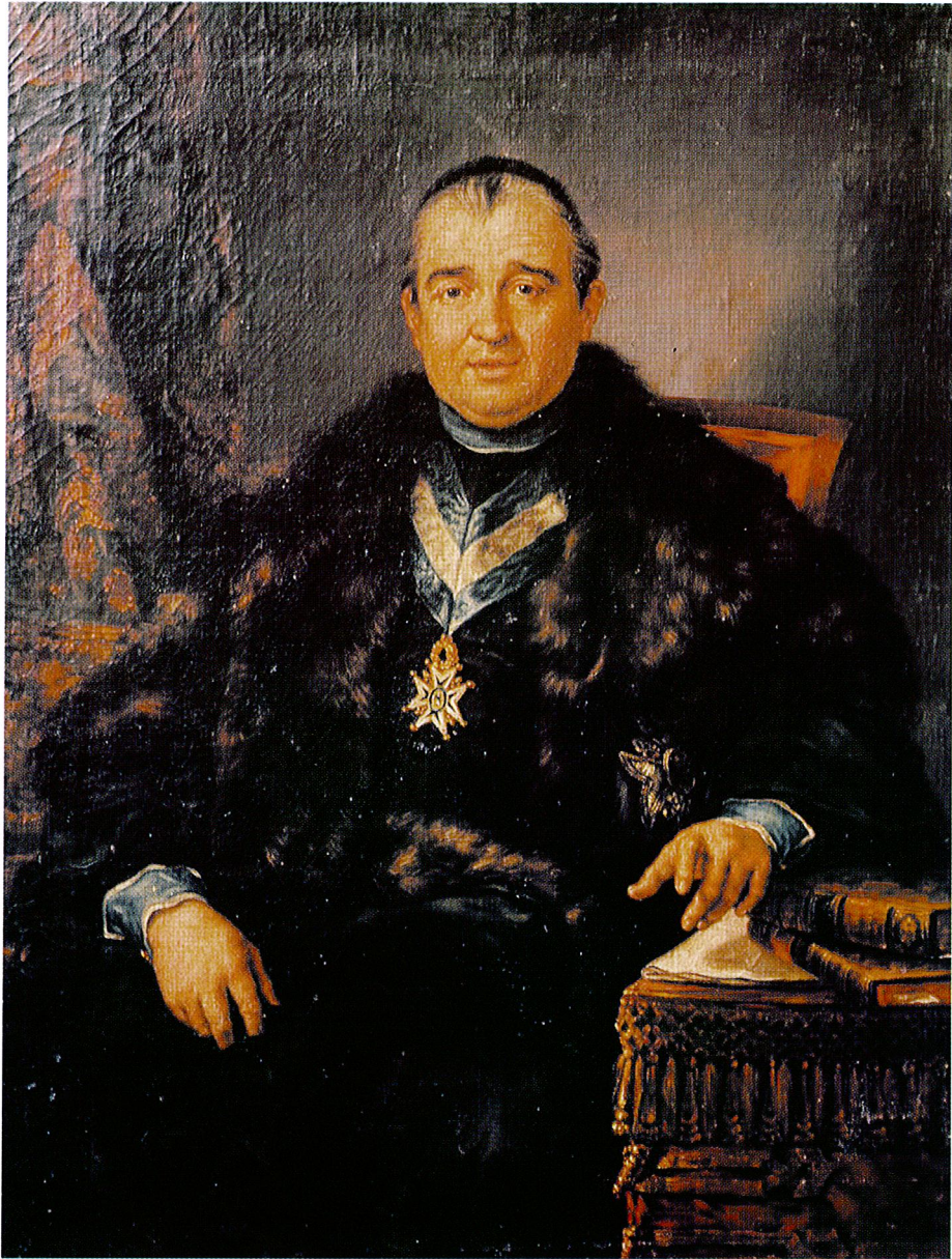
El doctor don Manuel Fernández Varela. (Óleo sobre tela de Vicente López.)