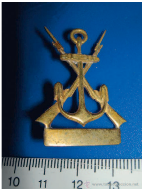
Emblema del Cuerpo de Infantería de Marina conforme al diseño publicado por orden de 25 de abril de 1931, sin corona y con galón de 20 mm de largo por 5 mm de ancho bajo él, que debían usar en el cuello los ayudantes auxiliares primeros graduados de alférez de fragata.

Como vimos, por orden de 16 de abril de 1932 se hizo extensivo a la Infantería de Marina el decreto de 22 de marzo de ese mismo año que concedía a los auxiliares primeros y segundos en activo de los Cuerpos Auxiliares graduación de alférez de fragata. El citado decreto disponía que los auxiliares mencionados usarían como uniforme la americana y la levita, así como la gorra de plato con orla, como los oficiales. Así pues, hecha extensiva esta potestad a los ayudantes auxiliares primeros y segundos de Infantería de Marina, podían estos desde ese momento usar dichos uniformes, si bien el uso de la americana ya lo tenían autorizado con anterioridad, tal y como se ha visto. En principio quedaban fuera del ámbito de estas disposiciones los 1. os ayudantes auxiliares de primera, pero es obvio que, siendo esa graduación inherente a su empleo efectivo, les eran también de aplicación esos cambios en la uniformidad.